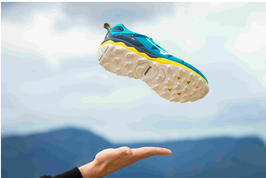
Mizuno Wave Daichi 6 con suola Michelin è perfetta per ogni tipo di terreno

Mizuno Wave Daichi 6 con suola Michelin è la nuova proposta di Casa Mizuno , che rinnova la propria collezione trail e presenta una calzatura estremamente performante, perfetta per lo spirito avventuriero di ogni trail runner.