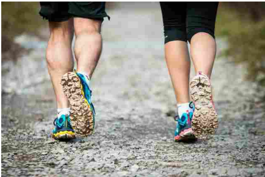
Due versioni differenti, uomo donna, ma con le stesse caratteristiche di performance, per permettere una sfida sempre al limite, grazie alle numerose tecnologie costruttive presenti e al compound estremamente performante della suola Michelin

Caratterizzata dalla suola con compound Michelin assicura un grip impareggiabile su ogni tipo di terreno. Non teme le insidie dei fondi bagnati, assicurando ad ogni appoggio quel giusto senso di sicurezza fondamentale per affrontare al meglio i terreni outdoor.