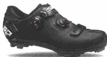
SIDI MTB DRAGON 5 SRS MATT MEGA misure: EUR da 40 a 48 - prezzo: euro 279,00

Tomaia in microfibra TechPro effetto opaco. Chiusura composta dal Soft Instep Closure System 4, doppio meccanismo micrometrico Tecno-3 Push System e cinturino velcro con High Security System. Plantare sagomato, estraibile. Suola Mtb SRS Carbon Composite, in nylon e fibra di carbonio, con inserti facilmente sostituibili. Ramponabile. Indicata per ciclisti professionisti e di alto livello tecnico.