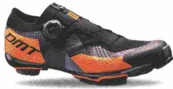
DMT KM1 misure: EUR da 37 a 48 - peso: g 295 - prezzo: euro 349,00

Tomaia in microfibra sintetica con stabilizzatore tallonare integrato e rinforzato in TPU. Chiusura composta da tripla fascia in Velcro. Plantare anatomico. Suola Mtb Carbon Composit, in nylon rinforzata da carbonio. Indicata per il ciclista di livello amatoriale.