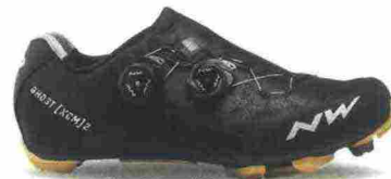
NORTHWAVE GHOST XCM 2 misure: EUR da 36 a 48 - peso: g 350 - prezzo: euro 249,99

Tomaia in microfibra forata a laser con tallone integrato. Chiusura composta da tripla fascia in Velcro. Plantare anatomico con supporto nella zona tarsale e traforato. Suola Mtb 2Density (doppia densità), in nylon e fibra di vetro. Indicata per chi si avvicina al mondo del ciclismo.