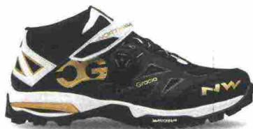
NORTHWAVE ENDURO MID misure: EUR da 38 a 48 - peso: g 480 - prezzo: euro 169,99

Tomaia a costruzione multistrato con rinforzi termosaldati e con protezioni in materiale sintetico su punta e tallone. Chiusura composta da rotore SLW2 con rilascio step by step e supportata da fascia in Velcro. Intersuola a rigidità calibrata. Suola X-Fire a doppia miscela; sviluppata in collaborazione con Michelin. Indicata per Enduro e Freeride. Note del produttore: scarpa sviluppata in collaborazione con il campione della disciplina, Cedric Gracia.