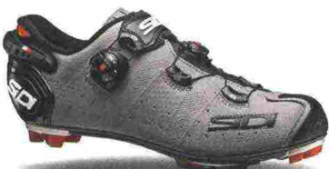
SIDI MTB DRAGO 2 SRS MATT misure: EUR da 39 a 48 - prezzo: euro 355,00

Tomaia in microfibra TechPro effetto opaco. Chiusura composta dal Soft Instep Closure System 4, doppio meccanismo micrometrico Tecno-3 Push System e cinturino velcro con High Security System. Plantare sagomato, estraibile. Suola Mtb SRS Carbon Composite, in nylon e fibra di carbonio, con inserti facilmente sostituibili. Ramponabile. Indicata per ciclisti professionisti e di alto livello tecnico. Note del produttore: destinata a chi necessita di una calzata ampia (Mega).