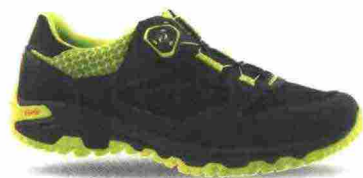
GAERNE G.VOLT misure: EUR da 38 a 47 - peso: g 415 - prezzo: euro 129,90

Tomaia in nylon mesh con rinforzi e protezioni antiabrasione su punta, lati e tallone. Chiusura composta da rotore Boa L6. Plantare anatomico, traspirante e antibatterico. Intersuola in EVA. Suola G.Explorer Vibram con rinforzi laterali per incrementare trazione e stabilità. Compatibile con tutti gli attacchi a sgancio rapido. Indicata per Freeride e All Terrain.