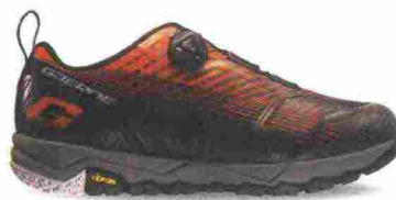
GAERNE G.TASER misure: EUR da 39 a 47 - peso: g 502 - prezzo: euro 159,90

Tomaia in nylon mesh con rinforzi e protezioni antiabrasione su punta, lati e tallone. Chiusura composta da rotore Boa L6. Plantare anatomico, traspirante e antibatterico. Intersuola in EVA. Suola G.Tourer Vibram. Indicata per Freeride e spostamenti urbani.