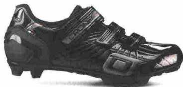
CRONO CX-4 misure: EUR da 37 a 48 - prezzo: euro 99,90

Tomaia in microfibra sintetica con stabilizzatore tallonare integrato e rinforzato in TPU. Chiusura composta da tripla fascia in Velcro. Plantare anatomico. Suola Mtb Carbon Composit, in nylon rinforzata da carbonio. Indicata per il ciclista di livello amatoriale.