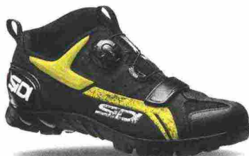
SIDI MTB DEFENDER misure: EUR da 38 a 48 - prezzo: euro 179,00

Tomaia in materiale sintetico forato a laser, rivestito con film protettivo idrorepellente e con protezione in gomma su punta e lati. Chiusura composta da rotore SLW2 con rilascio step by step. Intersuola a rigidità calibrata. Suola Explorer con battistrada in gomma Michelin. Indicata per Enduro e Freeride.