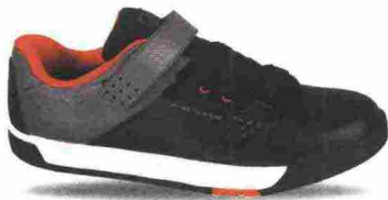
EXUSTAR E-SB7011 misure: EUR da 37 a 48 - peso: g 408

Tomaia in materiale poliuretano con inserti in mesh elasticizzato e fori di areazione. Chiusura composta da lacci trattenuti da occhielli rinforzati e supportata da fascia in Velcro. Plantare in EVA, lavabile. Intersuola in Bio Sole. Suola in gomma antiscivolo. Indicata per chi pratica BMX. Note del produttore , categoria Exustar: BMX Sport.