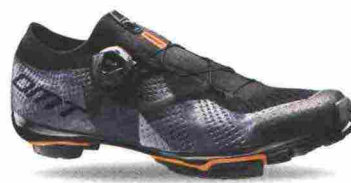
DMT KM1 misure: EUR da 37 a 48 - peso: g 295 - prezzo: euro 349,00

Tomaia ingegnerizzata, in Knit 3D con applicazioni antiusura termosaldate e protezione in gomma sulla punta. Chiusura composta da rotore Boa IP1. Plantare anatomico, in polipropilene con fori di areazione. Suola in carbonio unidirezionale con inserti in gomma. Indicata per atleti professionisti e ciclisti esperti. Note del produttore: gli inserti in gomma della suola sono stati studiati e realizzati in collaborazione con Michelin.