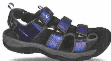
EXUSTAR E-SS515C misure: EUR da 37 a 48 - peso: g 480

Tomaia in mesh rinforzato da applicazioni termosaldate in poliuretano. Chiusura composta da lacci, trattenuti da fettucce incrociate, integrate e a sostegno della tomaia. Plantare in EVA, lavabile. Intersuola in EVA. Suola in gomma. Indicata per Freeride e spostamenti urbani. Note del produttore , categoria Exustar: Mtb Sport.