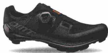
DMT KM3 misure: EUR da 37 a 48 - peso: g 285 - prezzo: euro 215,00

Tomaia ingegnerizzata, in Knit con applicazioni antiusura termosaldate e protezione sulla punta. Chiusura composta da rotore Boa IP1. Plantare in polipropilene con fori di areazione. Suola in carbonio Toray MR60 con tacchetti intercambiabili. Indicata per atleti di medio e alto livello.