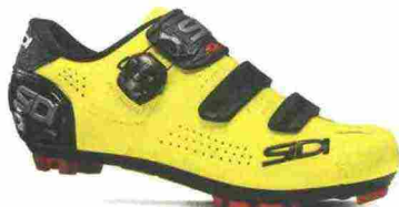
SIDI MTB TRACE 2 misure: EUR da 36 a 48 - prezzo: euro 159,00

Tomaia in Politec con contrafforte rinforzato. Chiusura composta da meccanismo micrometrico Tecno-3 e Soft Instep Closure System, supportata da doppio cinturino in Velcro. Plantare sagomato, removibile. Suola Mtb SR 17, in nylon con inserti in poliuretano e con puntale sostituibile. Ramponabile. Indicata per il ciclista di buon livello tecnico.