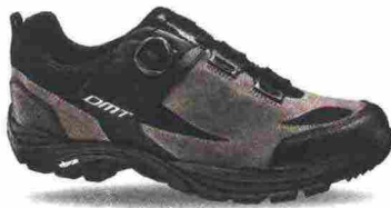
DMT DFR1 misure: EUR da 36 a 48 - peso: g 390 - prezzo: euro 135,00

Tomaia in crosta con inserti in mesh, rinforzo laterale in materiale sintetico e protezioni su punta e tallone. Chiusura composta da rotore Boa L5 con triplo passaggio. Plantare in polipropilene con fori di areazione. Suola Vibram S188 con piastra per attacchi smontabile. Indicata per Freeride e spostamenti urbani.