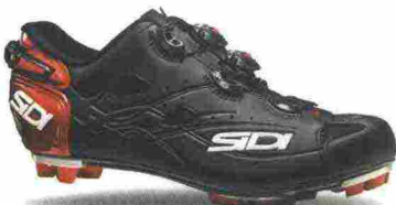
SIDI MTB TIGER SRS MATT CARBON misure: EUR da 40 a 48 - prezzo: euro 389,00

Tomaia in microfibra Microtech effetto opaco con inserti in mesh. Chiusura composta dal Soft Instep Closure System 4, doppio meccanismo micrometrico Tecno-3 Push System. Plantare sagomato, removibile. Suola Mtb SR 17, in nylon con inserti in poliuretano e con puntale sostituibile. Ramponabile. Indicata per atleti di medio e alto livello tecnico.