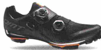
DMT MH1 misure: EUR da 37 a 47 - peso: g 300 - prezzo: euro 290,00

Tomaia ingegnerizzata, in Knit con applicazioni antiusura termosaldate e protezione sulla punta. Chiusura composta da rotore Boa IP1. Plantare in polipropilene con fori di areazione. Suola in carbonio Toray MR60 con tacchetti intercambiabili. Indicata per atleti di medio e alto livello.