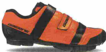
GAERNE G.LASER misure: EUR da 37 a 48 - peso: g 382 - prezzo: euro 109,90

Tomaia in microfibra G.Active Airflow con rinforzi antiabrasione (laterali e punta) e con inserti catarifrangenti Reflex; collarino elasticizzato in Gore-Tex Rattler e membrana Gore-Tex Duratherm. Chiusura composta da rotore Boa IP-1. Plantare anatomico con supporto nella zona tarsale. Intersuola isolante, con l'aggiunta di alluminio termo-riflettente, in grado di creare una barriera termica. Suola Mtb, in nylon e fibra di vetro con battistrada in gomma. Ramponabile. Indicata per un uso invernale, in condizioni climatiche rigide.