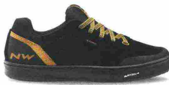
NORTHWAVE TRIBE misure: EUR da 36 a 49 - peso: g 435 - prezzo: euro 99,99

Tomaia a costruzione multistrato con rinforzi termosaldati e con protezioni in materiale sintetico su punta e tallone. Chiusura composta da rotore SLW2 con rilascio step by step e supportata da fascia in Velcro. Intersuola a rigidità calibrata. Suola X-Crossbow Michelin con tasselli autopulenti. Indicata per Enduro e Freeride.