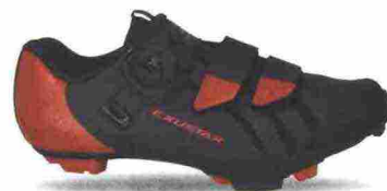
EXUSTAR E-SM3010 misure: EUR da 37 a 48 - peso: g 363

Tomaia ingegnerizzata, in Knit 3D e materiale sintetico con protezione sulla punta. Chiusura composta da doppio rotore Boa IP1. Plantare anatomico, in polipropilene con fori di areazione. Suola in carbonio unidirezionale con inserti in gomma. Indicata per atleti professionisti e ciclisti esperti. Note del produttore: gli inserti in gomma della suola sono stati studiati e realizzati in collaborazione con Michelin.