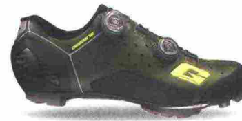
GAERNE CARBON G.SINCRO misure: EUR da 39 a 47 - peso: g 348 - prezzo: euro 339,90

Tomaia in microfibra forata a laser con stabilizzatore tallonare integrato. Chiusura composta da doppio rotore Boa IP-1. Plantare anatomico con supporto nella zona tarsale e traforato. Suola EPS Light Mtb con struttura in fibra di carbonio e battistrada in gomma Michelin. Ramponabile. Indicata per ciclisti professionisti ed esperti. Note del produttore: disponibile anche con suola EPS Carbon Power Mtb con struttura in nylon rinforzata in fibra di carbonio.