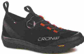
CRONO CD1 misure: EUR da 39 a 46 - prezzo: euro 149,00

CICLOTURISMO - Vere e proprie scarpe da ciclismo, generalmente compatibili con l'attacco a sgancio rapido, ma disegnate secondo i criteri tipici delle più comuni calzature da tempo libero. Oltre a buone performance in bicicletta, offrono un notevole comfort nel camminare su sterrato (se sono da trekking) o su asfalto (se da turismo).