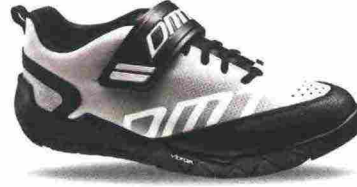
DMT E2 misure: EUR da 37 a 48 - peso: g 480 - prezzo: euro 135,00

Tomaia in microfibra forata con protezioni in materiale sintetico su punta e tallone; foderata in rete di nylon. Chiusura composta da lacci e supportata da fascia in Velcro. Plantare in poliuretano con rinforzi ammortizzanti in Poron. Suola Vibram S188 con piastra per attacchi smontabile. Indicata per Enduro e spostamenti urbani.