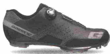
GAERNE CARBON G.HURRICANE misure: EUR da 39 a 47 - peso: g 321 - prezzo: euro 199,90

Tomaia in materiale poliuretano con tagli di areazione a laser; foderata in mesh. Chiusura composta da tripla fascia in Velcro. Plantare in EVA, lavabile. Suola in nylon e fibra di vetro con battistrada in gomma antiscivolo. Ramponabile. Indicata per atleti di medio livello tecnico. Note del produttore, categoria Exustar: Mtb Sport.