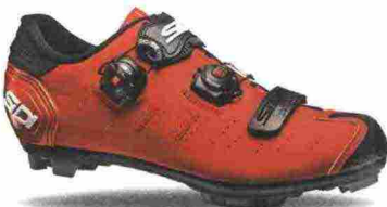
SIDI MTB DRAGON 5 SRS MATT misure: EUR da 39 a 48 - prezzo: euro 279,00

Tomaia in microfibra TechPro effetto opaco con parti traforate. Chiusura composta dal Soft Instep Closure System 4 con meccanismo micrometrico Tecno-3 Push e Single Tecno-3 Push; tutti sostituibili. Plantare sagomato e removibile. Suola Mtb SRS Carbon Ground, in carbonio con inserti in poliuretano facilmente sostituibili. Ramponabile. Indicata per atleti professionisti e ciclisti di alto livello tecnico.