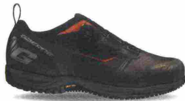
GAERNE G.RAY misure: EUR da 39 a 47 - peso: g 382 - prezzo: euro 149,90

Tomaia in nylon mesh con rinforzi e protezioni antiabrasione su punta, lati e tallone. Chiusura composta da rotore Boa L6. Plantare anatomico, traspirante e antibatterico. Intersuola in EVA. Suola G.Tourer Vibram. Indicata per Freeride e spostamenti urbani.