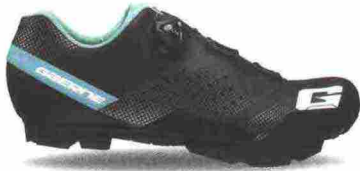
GAERNE G. HURRICANE LADY misure: EUR da 37 a 43 - peso: g 318 - prezzo: euro 159,90

Tomaia in microfibra forata a laser con stabilizzatore tallonare integrato. Chiusura composta da rotore Boa System L6. Plantare anatomico con supporto nella zona tarsale e traforato. Suola Mtb 2Density (doppia densità), in nylon e fibra di vetro. Indicata per atlete di medio e alto livello tecnico.