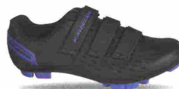
EXUSTAR E-SM3156 misure: EUR da 37 a 48 - peso: g 336

Tomaia realizzata con costruzione Smooth Form (senza cuciture), in materiale poliuretano con fori di areazione e vasta protezione in TPU sulla punta. Chiusura composta da rotore Atop Microlock e supportata da doppia fascia in Velcro. Plantare in EVA, lavabile. Suola in nylon e fibra di vetro con battistrada in gomma antiscivolo. Ramponabile. Indicata per atleti di medio e alto livello. Note del produttore, categoria Exustar: Mtb Comp.