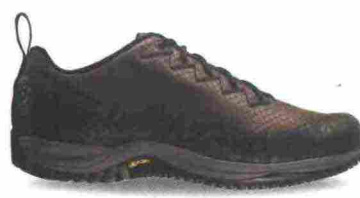
GAERNE G.ARC misure: EUR da 37 a 47 - peso: g 364 - prezzo: euro 129,90

Tomaia composta da fasce in suede e microfibra con ampia protezione in gomma sulla punta; foderata in neoprene. Chiusura composta da quattro fasce in Velcro, di cui una regolabile sul tallone. Plantare in EVA, lavabile. Intersuola in EVA. Suola in gomma. Indicata per il cicloturista occasionale. Note del produttore , categoria Exustar: Sandals Sport.