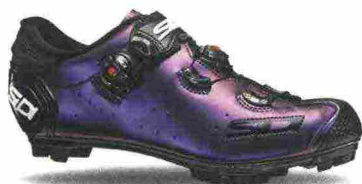
SIDI JARIN misure: EUR da 40 a 48 - prezzo: euro 389,00

Tomaia assemblata con costruzione Xframe 2, in microfibra perforata a laser con protezioni in gomma antiabrasione su punta, lati e tallone. Chiusura composta da doppio rotore SLW2 con rilascio step by step. Plantare Performance Regular. Suola Carbon XC 12 con inserto in carbonio nella zona del pedale e sezioni in TPU posizionate strategicamente. Ramponabile. Indicata per ciclisti professionisti e atleti esigenti.