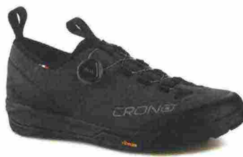
CRONO CE1 misure: EUR da 39 a 46 - prezzo: euro 149,00

Tomaia in pelle scamosciata idrorepellente con rinforzo tallonare e protezione sulla punta. Chiusura composta da rotore micrometrico Boa L6. Plantare anatomico, termoformato. Suola Vibram con mescola SuperGrip. Compatibile con attacchi per pedali Flat. Indicata per Downhill e spostamenti urbani.