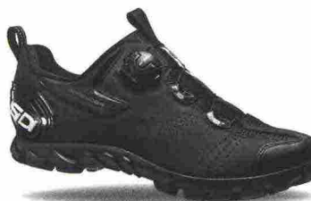
SIDI MTB DEFENDER 20 misure: EUR da 38 a 48 - prezzo: euro 179,00

Tomaia in Politec effetto scamosciato con inserti in mesh; protezione interna del malleolo e paracolpi antishock, esterno, in poliuretano con imbottitura interna. Tirante Loop su tallone e lingua. Chiusura composta da meccanismo micrometrico Tecno-3 e supportata da un cinturino in Velcro. Plantare sagomato, removibile. Suola Outdoor, in gomma con inserto rigido per maggior trasmissione tra calzatura e piede. Indicata per Freeride e spostamenti urbani.