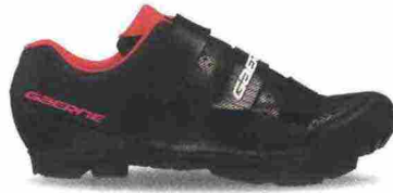
GAERNE G. LASER LADY misure: EUR da 36 a 43 - peso: g 326 - prezzo: euro 109,90

Tomaia in microfibra forata a laser con stabilizzatore tallonare integrato. Chiusura composta da rotore Boa System L6. Plantare anatomico con supporto nella zona tarsale e traforato. Suola Mtb 2Density (doppia densità), in nylon e fibra di vetro. Indicata per atlete di medio e alto livello tecnico.