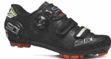
SIDI MTB TRACE 2 WOMAN misure: EUR da 36 a 42 - prezzo: euro 169,00

Tomaia in microfibra forata a laser con stabilizzatore tallonare integrato. Chiusura composta da tripla fascia in Velcro. Plantare anatomico con supporto nella zona tarsale e traforato. Suola Mtb 2Density (doppia densità), in nylon e fibra di vetro. Indicata per chi si avvicina al mondo del ciclismo.