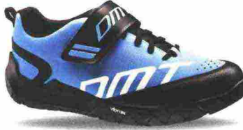
DMT E2 misure: EUR da 37 a 48 - peso: g 480 - prezzo: euro 135,00

Tomaia in crosta con inserti in mesh, rinforzo laterale in materiale sintetico e protezioni su punta e tallone. Chiusura composta da rotore Boa L5 con triplo passaggio. Plantare in polipropilene con fori di areazione. Suola Vibram S188 con piastra per attacchi smontabile. Indicata per Freeride e spostamenti urbani.