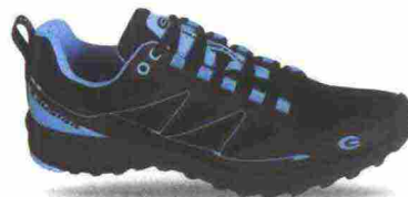
EXUSTAR E-SM807-BL misure: EUR da 37 a 48 - peso: g 317

Tomaia in mesh rinforzato da applicazioni termosaldate in poliuretano. Chiusura composta da lacci, trattenuti da fettucce e da occhiello rinforzato; integrata e a sostegno della tomaia. Plantare in EVA, lavabile. Intersuola in EVA. Suola in gomma. Indicata per Freeride e spostamenti urbani. Note del produttore , categoria Exustar: Mtb Sport.