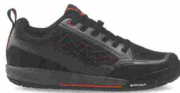
NORTHWAVE GLAN misure: EUR da 36 a 49 - peso: g 425 - prezzo: euro 139,99

Tomaia in suede con pannelli in nylon mesh. Chiusura composta da rotore Boa L6. Plantare anatomico, con trattamento antibatterico. Intersuola in EVA. Suola Vibram. Indicata per Freeride e spostamenti urbani.