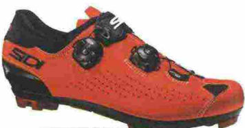
SIDI MTB EAGLE 10 misure: EUR da 36 a 48 - prezzo: euro 219,00

Tomaia in microfibra TechPro effetto opaco con tallone tecnico regolabile sullo spoiler. Chiusura composta dal Soft Instep Closure System 4 con meccanismo micrometrico Tecno-3 Push e Single Tecno-3 Push; tutti sostituibili. Plantare sagomato e removibile. Suola Mtb SRS Carbon Ground, in carbonio con inserti in poliuretano facilmente sostituibili. Ramponabile. Indicata per atleti professionisti e ciclisti di alto livello tecnico.