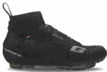
GAERNE G.ICE STORM MTB GORE-TEX misure: EUR da 39 a 48 - peso: g 448 - prezzo: euro 249,90

Tomaia in microfibra G.Active Airflow con rinforzi antiabrasione (laterali e punta) e con inserti catarifrangenti Reflex; collarino elasticizzato in Gore-Tex Rattler e membrana Gore-Tex Duratherm. Chiusura composta da rotore Boa IP-1. Plantare anatomico con supporto nella zona tarsale. Intersuola isolante, con l'aggiunta di alluminio termo-riflettente, in grado di creare una barriera termica. Suola Mtb, in nylon e fibra di vetro con battistrada in gomma. Ramponabile. Indicata per un uso invernale, in condizioni climatiche rigide.