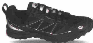
EXUSTAR E-SM807 misure: EUR da 37 a 48 - peso: g 317

Tomaia in materiale poliuretano con inserti in mesh elasticizzato e fori di areazione. Chiusura composta da lacci trattenuti da occhielli rinforzati e supportata da fascia in Velcro. Plantare in EVA, lavabile. Intersuola in Bio Sole. Suola in gomma antiscivolo. Indicata per chi pratica BMX. Note del produttore , categoria Exustar: BMX Sport.