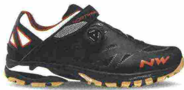
NORTHWAVE SPIDER PLUS 2 misure: EUR da 36 a 49 - peso: g 414 - prezzo: euro 139,99

Tomaia a costruzione multistrato con rinforzi termosaldati e con protezioni in materiale sintetico su punta e tallone. Chiusura composta da rotore SLW2 con rilascio step by step e supportata da fascia in Velcro. Intersuola a rigidità calibrata. Suola X-Fire a doppia miscela; sviluppata in collaborazione con Michelin. Indicata per Enduro e Freeride. Note del produttore: scarpa sviluppata in collaborazione con il campione della disciplina, Cedric Gracia.