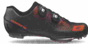
GAERNE CARBON G.KOBRA misure: EUR da 39 a 47 - peso: g 341 - prezzo: euro 289,90

Tomaia in microfibra forata a laser con tallone integrato. Chiusura composta da rotore Boa System L6. Plantare anatomico con supporto nella zona tarsale e traforato. Suola EPS Light Mtb con struttura in fibra di carbonio e battistrada in gomma Michelin. Ramponabile. Indicata per atleti di medio e alto livello tecnico. Note del produttore: disponibile anche con suola Mtb 2Density, in nylon e fibra di vetro.