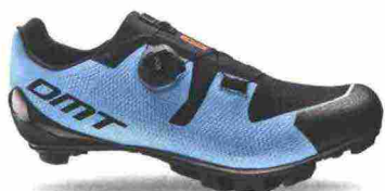
DMT KM3 misure: EUR da 37 a 48 - peso: g 285 - prezzo: euro 215,00

Tomaia ingegnerizzata, in Knit 3D con applicazioni antiusura termosaldate e protezione in gomma sulla punta. Chiusura composta da rotore Boa IP1. Plantare anatomico, in polipropilene con fori di areazione. Suola in carbonio unidirezionale con inserti in gomma. Indicata per atleti professionisti e ciclisti esperti. Note del produttore: gli inserti in gomma della suola sono stati studiati e realizzati in collaborazione con Michelin.