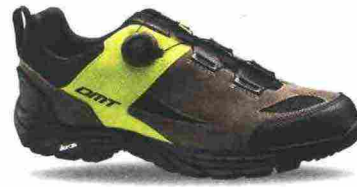
DMT DFR1 misure: EUR da 36 a 48 - peso: g 390 - prezzo: euro 135,00

Tomaia in pelle scamosciata idrorepellente con rinforzo tallonare e protezione sulla punta. Chiusura composta da rotore micrometrico Boa L6. Plantare anatomico, termoformato. Suola Vibram. Compatibile con attacchi SPD. Indicata per Downhill e spostamenti urbani.