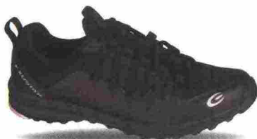
EXUSTAR E-SM817 misure: EUR da 37 a 48 - peso: g 341

Tomaia in mesh rinforzato da applicazioni termosaldate in poliuretano. Chiusura composta da lacci, trattenuti da fettucce e da occhiello rinforzato; integrata e a sostegno della tomaia. Plantare in EVA, lavabile. Intersuola in EVA. Suola in gomma. Indicata per Freeride e spostamenti urbani. Note del produttore , categoria Exustar: Mtb Sport.