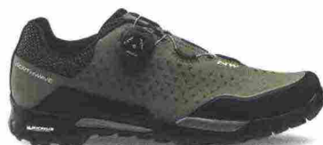
NORTHWAVE X-TRAIL PLUS misure: EUR da 36 a 49 - peso: g 362 - prezzo: euro 134,99

Tomaia in suede con ampi inserti in rete mesh con protezioni in gomma stampata, antiabrasione, su punta e tallone. Chiusura composta da lacci con banda elastica fermastringhe. Suola sviluppata in collaborazione con Michelin. Indicata per Freeride, Gravity ed e-Bike.