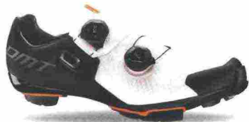
DMT MH1 misure: EUR da 37 a 47 - peso: g 300 - prezzo: euro 290,00

Tomaia ingegnerizzata, in Knit 3D e materiale sintetico con protezione sulla punta. Chiusura composta da doppio rotore Boa IP1. Plantare anatomico, in polipropilene con fori di areazione. Suola in carbonio unidirezionale con inserti in gomma. Indicata per atleti professionisti e ciclisti esperti. Note del produttore: gli inserti in gomma della suola sono stati studiati e realizzati in collaborazione con Michelin.