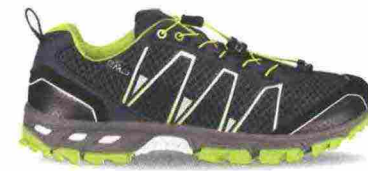
CMP ALTAK WP misure: EUR da 39 a 47 - prezzo: euro 79,95

Tomaia in Knit mesh con rinforzi e protezioni in TPU termosaldato su punta, lati e tallone. Allacciatura tradizionale, con tasca per le stringhe sulla linguetta. Plantare sagomato in EVA, estraibile. Intersuola in mescola BioMoGo DNA con piastra di protezione. Differenziale 8 mm. Suola con maggiore trazione, grazie all'innovativo TrailTack e al disegno a tasselli. Note del produttore , categoria Brooks: Trail/Cushion.