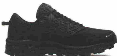
ASICS GEL FUJITRABUCO 8 G-TX misure: US da 6 a 15 - prezzo: euro 150,00

Tomaia in mesh con rinforzi e protezioni in materiale sintetico; dotata di attacco GaiterTrap sul tallone. Intersuola a doppio strato, in EVA e A-Bound, con tecnologia InnerFlex. Altezza 33 mm. Differenziale 0 mm. Suola Vibram MegaGrip con disegno a trazione multidirezionale e tecnologia FootShape. Note del produttore : possibilità di inserimento di ghetta tramite tecnologia GaiterTrap. Categoria Altra Running: Trail.