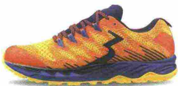
361° YUSHAN misure: US da 7 a 14 - peso: g 348 - prezzo: euro 139,99

Tomaia realizzata senza cuciture, in mesh con applicazioni termosaldate e protezione BigToe sulla punta. Allacciatura tradizionale con linguetta Pressure Free Tongue a soffietto. Intersuola in QuikFoam a tutta lunghezza con piastra di protezione, flessibile, StoneShield nell'avampiede. Differenziale 8 mm (18/26). Suola monoscocca, in gomma resistente all'abrasione con canali di flessione QuikFlex 4Foot Engineering e battistrada Ultra Gripping con profondi tasselli. Note del produttore , categoria 361°: Trail Running.