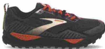
BROOKS CASCADIA 15 GTX misure: US da 7 a 14 - peso: g 334 - prezzo: euro 160,00

Tomaia in mesh con rinforzi e protezioni in TPU termosaldato su punta, lati e tallone; Gaiter Tab integrato sul tallone. Allacciatura tradizionale, con tasca per le stringhe sulla linguetta. Plantare sagomato in EVA, estraibile. Intersuola in mescola BioMoGo DNA. Differenziale 4 mm. Suola con maggiore trazione, grazie all'innovativo TrailTack e al disegno a tasselli. Note del produttore : possibilità di inserimento ghetta tramite tecnologia Gaiter Tab. Categoria Brooks: Trail/Energie.