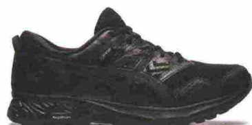
ASICS GEL SONOMA 5 G-TX misure: US da 6 a 15 - prezzo: euro 100,00

Tomaia in mesh con rinforzi in materiale sintetico, supporto mediale in TPU e protezioni in gomma su punta, lati e tallone; membrana Gore-Tex. Allacciatura integrata e a sostegno della tomaia, con tasca per le stringhe sulla linguetta. Plantare sagomato in EVA, estraibile. Intersuola in FlyteFoam Lyte con unità ammortizzante Gel nella zona tallonare e inserto antipronazione DuoMax; piastra di protezione Rock. Differenziale 8 mm. Suola Asics Grip con disegno del battistrada con tacchetti multidirezionali. Note del produttore , categoria Asics: Running Trail.