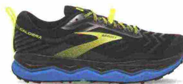
BROOKS CALDERA 4 misure: US da 7 a 15 - peso: g 290 - prezzo: euro 140,00

Tomaia in Open mesh e TPU con rinforzi e protezioni termosaldati e cuciti in materiale sintetico; membrana Gore-Tex. Plantare Ortholite, estraibile. Intersuola in AmpliFoam con unità ammortizzante Gel nella zona tallonare e stabilizzatore, interno, Trusstic. Differenziale 10 mm. Suola in gomma solida con disegno specifico da trail. Note del produttore , categoria Asics: Running Trail.