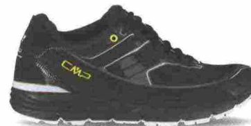
CMP KURSA WP misure: EUR da 39 a 47 - prezzo: euro 119,95

Tomaia in mesh e poliestere con rinforzi in microfibra e protezioni in TPU su punta e tallone. Allacciatura Fast Lacing, chiusa da clip e trattenuta da occhielli rinforzati. Plantare in poliestere ed EVA. Intersuola in EVA a volumi differenziati. Differenziale 10 mm. Suola in gomma con mescola CMP FullOn Grip.