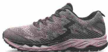
361° YUSHAN WP misure: US da 7 a 14 - peso: g 375 - prezzo: euro 149,99

Tomaia realizzata senza cuciture, in mesh con applicazioni termosaldate e protezione BigToe sulla punta. Allacciatura tradizionale con linguetta Pressure Free Tongue a soffietto. Intersuola in QuikFoam a tutta lunghezza con piastra di protezione, flessibile, StoneShield nell'avampiede. Differenziale 8 mm (18/26). Suola monoscocca, in gomma resistente all'abrasione con canali di flessione QuikFlex 4Foot Engineering e battistrada Ultra Gripping con profondi tasselli. Note del produttore , categoria 361°: Trail Running.