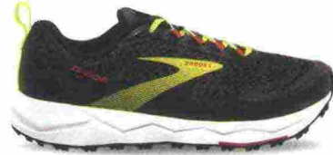
BROOKS DIVIDE misure: US da 7 a 15 - peso: g 292 - prezzo: euro 110,00

Tomaia in mesh ingegnerizzato con rinforzi e protezioni stampate e termosaldate in 3D; membrana Gore-Tex invisibleFit. Allacciatura tradizionale, con tasca per le stringhe sulla linguetta. Plantare sagomato in EVA, estraibile. Intersuola in mescola BioMoGo DNA con stabilizzatori Pivot Post e con piastra di protezione. Differenziale 8 mm. Suola con maggiore trazione, grazie al TrailTack e al disegno del battistrada a tasselli multidirezionali. Note del produttore , categoria Brooks: Trail/Cushion.