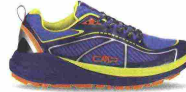
CMP NASHIRA MAXI misure: EUR da 39 a 47 - prezzo: euro 79,95

Tomaia in mesh ingegnerizzato con bordo e protezioni in microfibra e con stabilizzatore tallonare in poliuretano (PU); trattamento idrorepellente Waterproof e membrana KlimaProtect. Allacciatura tradizionale, trattenuta da fettucce e occhiello rinforzato. Plantare in poliestere ed EVA. Intersuola in Phylon ed EVA. Differenziale 5 mm. Suola in Vibram Fuga S927 con mescola MegaGrip.