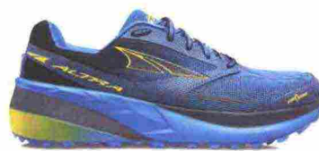
ALTRA RUNNING OLYMPUS 3.5 misure: US da 8 a 16 - peso: g 303 - prezzo: euro 155,00

Tomaia realizzata senza cuciture, in mesh con applicazioni termosaldate e protezione BigToe sulla punta; membrana Waterproof. Allacciatura tradizionale con linguetta Pressure Free Tongue a soffietto. Plantare in QuikFoam, sagomato anatomicamente. Intersuola in QuikFoam a tutta lunghezza con piastra di protezione, flessibile, StoneShield nell'avampiede. Differenziale 8 mm (18/26). Suola monoscocca, in gomma resistente all'abrasione con canali di flessione QuikFlex 4Foot Engineering e battistrada Ultra Gripping con profondi tasselli. Note del produttore , categoria 361°: Trail Running.