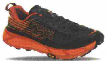
HOKA ONEONE EVO MAFATE 2 misure: US da 7 a 14 - peso: g 291 - prezzo: euro 190,00

Tomaia in mesh a doppio strato con protezione in TPU strutturato sulla punta e contrafforte tallonare rinforzato internamente. Allacciatura integrata e a sostegno della tomaia, tramite i sostegni laterali, interni, elasticizzati. Intersuola in EVA e CMEVA con geometria Meta-Rocker. Differenziale 5 mm (24/29). Suola in gomma con tasselli da 4 mm. Note del produttore, categoria Hoka OneOne: Sky ATR.