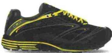
GMP MAIA misure: EUR da 39 a 47 - prezzo: euro 99,95

Tomaia monosock, in mesh con rifiniture e sovrapposizioni termosaldate e stampate in 3D; protezione in gomma sulla punta. Plantare sagomato in EVA, estraibile. Intersuola in FlyteFoam Lyte. Differenziale 4 mm. Suola Asics Grip con disegno del battistrada con tacchetti multidirezionali. Note del produttore, categoria Asics: Running Trail.