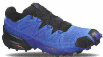
SALOMON SPEEDCROSS 5 GTX misure: UK da 6m a 13m - peso: g 340 - prezzo: euro 160,00

Tomaia su struttura SensiFit, in mesh chiuso con rinforzi termosaldati in materiale termoplastico e protezioni in gomma sulla punta; membrana Gore-Tex. Allacciatura Quicklace, con tasca per le stringhe sulla linguetta. Plantare Ortholite, estraibile. Intersuola interna, in EVA modellata e iniettata. Differenziale 10 mm (20,9/30,9). Suola Contagrip TA con tasselli pronunciati. Note del produttore , categoria Salomon: Trail Running.