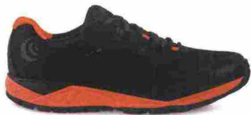
TOPO ATHLETIC MT-3 misure: US da 8 a 15 - peso: g 281 - prezzo: euro 145,00

Tomaia in eVent (impermeabile e traspirante) a strato singolo con rinforzi e protezioni termosaldate in poliuretano. Linguetta a soffietto. Allacciatura tradizionale, trattenuta da fettucce, integrata e a sostegno della tomaia. Plantare Ortholite da 5 mm, estraibile. Intersuola in EVA iniettata a doppia densità con piastra di protezione Rock Plate nell'avampiede. Differenziale 3 mm (22/25). Suola Vibram MegaGrip. Note del produttore : dotata con doppi lacci di colore differente. Categoria Topo Athletic: Trail Waterproof.