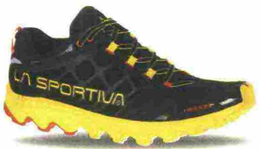
LA SPORTIVA HELIOS SR misure: EUR da 38 a 47m - peso: g 230 - prezzo: euro 135,00

Tomaia in Air mesh con pannelli in RipStop, rinforzi in film termoplastico e scheletro in TPU applicato ad alta frequenza nella zona mediale; protezione in TPU su punta e tallone. Allacciatura tradizionale, integrata e a sostegno della tomaia. Plantare Ortholite Ergonomic da 4 mm. Intersuola in EVA compressa con stabilizzatore Stability Control System. Differenziale 6 mm. Suola Frixion Red. Note del produttore, categoria La Sportiva: Mountain Running.