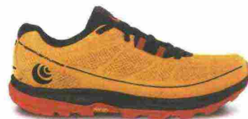
TOPO ATHLETIC TERRAVENTURE 2 misure: US da 8 a 15 - peso: g 306 - prezzo: euro 160,00

Tomaia in mesh resistente all'abrasione con rinforzi e protezioni termosaldate in poliuretano con fori di drenaggio. Linguetta a soffietto. Allacciatura tradizionale, con tasca per le stringhe sulla linguetta. Plantare in schiuma Ortholite con trattamento antibatterico; estraibile. Intersuola in EVA iniettata con piastra di protezione ESS nell'avampiede. Altezza 20 mm. Differenziale 0 mm. Suola Vibram XS Trek. Note del produttore : compatibile con ghetta in nylon elasticizzato. Categoria Topo Athletic: Trail.