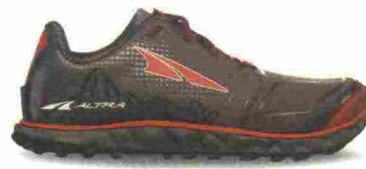
ALTRA RUNNING SUPERIOR 4 misure: US da 8 a 16 - peso: g 274 - prezzo: euro 130,00

Tomaia in mesh chiuso con rifiniture termosaldate, rinforzi in materiale sintetico e protezione in gomma su punta e tallone; dotata di attacco posteriore GaiterTrap. Intersuola a doppio strato, in EVA e A-Bound, con piastra di protezione StoneGuard a tutta lunghezza. Altezza 25 mm. Differenziale 0 mm. Suola Altra MaxTrac con disegno a trazione multidirezionale e con tecnologia FootShape. Note del produttore: possibilità di inserimento di ghetta tramite tecnologia GaiterTrap. Categoria Altra Running: Trail.