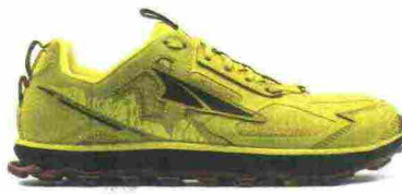
ALTRA RUNNING LONE PEAK 4.5 LOW misure: US da 8 a 16 - peso: g 298 - prezzo: euro 140,00

Tomaia in RipStop con rinforzi termosaldati e protezione in materiale sintetico sulla punta con fori di drenaggio; dotata di attacco GaiterTrap sul tallone. Allacciatura tradizionale, supportata da fascia FootLock a strappo. Intersuola in Altra EGO con piastra di protezione StoneGuard. Altezza 19 mm. Differenziale 0 mm. Suola Vibram con mescola MegaGrip Litebase e tasselli profondi 6 mm. Note del produttore: possibilità di inserimento di ghetta tramite tecnologia GaiterTrap. Categoria Altra Running: Trail.