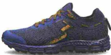
361° TAROKO 2 misure: US da 6 a 12 - peso: g 260 - prezzo: euro 119,99

Tomaia realizzata senza cuciture, in mesh resistente all'abrasione con protezione termosaldata sulla punta. Allacciatura Morphit Lacing System, combinato al sistema Pull Cord per una calzata personalizzabile. Intersuola in QuikFoam a tutta lunghezza con piastra di protezione. Differenziale 9 mm (17,5/26,5). Suola in gomma resistente all'abrasione con canali di flessione QuikFlex 4Foot Engineering. Note del produttore , categoria 361°: Trail Running.