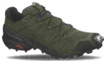
SALOMON SPEEDCROSS 5 WIDE misure: UK da 6m a 13m - peso: g 320 - prezzo: euro 130,00

Tomaia su struttura SensiFit, in mesh chiuso con rinforzi termosaldati in materiale termoplastico e protezioni in gomma sulla punta; membrana Gore-Tex. Allacciatura Quicklace, con tasca per le stringhe sulla linguetta. Plantare Ortholite, estraibile. Intersuola interna, in EVA modellata e iniettata. Differenziale 10 mm (20,9/30,9). Suola Contagrip TA con tasselli pronunciati. Note del produttore , categoria Salomon: Trail Running.