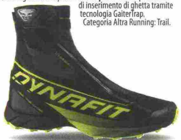
DYNAFIT SKY PRO misure: UK da 3 a 13 - peso: g 280 - prezzo: euro 250,00

Tomaia in mesh con rinforzi in microfibra, applicazioni termosaldate e protezione in poliuretano sulla punta. Allacciatura tradizionale, trattenuta da asole elasticizzate e da occhiello rinforzato in metallo. Plantare in poliestere ed EVA. Intersuola in Phylon ed EVA. Differenziale 8 mm. Suola Vibram Fast Trail S084.