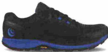
TOPO ATHLETIC RUNVENTURE 3 misure: US da 8 a 15 - peso: g 269 - prezzo: euro 160,00

Tomaia in mesh Rip-Stop e mesh con rivestimenti stampati e aperture per il drenaggio dell'acqua; protezione in gomma sulla punta. Allacciatura tradizionale, trattenuta da fettucce, integrata e a sostegno della tomaia. Plantare Ortholite con trattamento antimicrobico da 5 mm, estraibile. Intersuola in EVA iniettata a doppia densità. Differenziale 3 mm (22/25). Suola in gomma ad alta trazione. Note del produttore , categoria Topo Athletic: Trail.