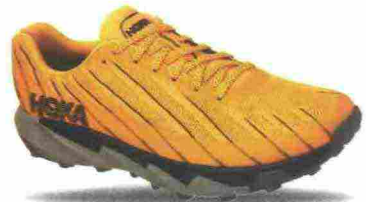
HOKA ONEONE TORRENT misure: US da 7 a 14 - peso: g 254 - prezzo: euro 130,00

Tomaia in tessuto Matrix con fili in Kevlar e rinforzata da applicazioni termosaldate; ampia protezione in gomma antiabrasione sulla punta. Allacciatura tradizionale con linguetta imbottita. Intersuola in EVA compressa con geometria Meta-Rocker e con supporto scolpito all'arco plantare. Differenziale 4 mm (29/33). Suola in Vibram e mescola di gomma con tasselli da 5 mm. Note del produttore, categoria Hoka OneOne: Race Trail.