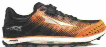
ALTRA RUNNING KING MT 2 misure: US da 8 a 16 - peso: g 246 - prezzo: euro 160,00

Tomaia in RipStop con rinforzi termosaldati e protezione in materiale sintetico sulla punta con fori di drenaggio; dotata di attacco GaiterTrap sul tallone. Allacciatura tradizionale, supportata da fascia FootLock a strappo. Intersuola in Altra EGO con piastra di protezione StoneGuard. Altezza 19 mm. Differenziale 0 mm. Suola Vibram con mescola MegaGrip Litebase e tasselli profondi 6 mm. Note del produttore: possibilità di inserimento di ghetta tramite tecnologia GaiterTrap. Categoria Altra Running: Trail.