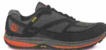
TOPO ATHLETIC HYDROVENTURE 2 misure: US da 8 a 15 - peso: g 289 - prezzo: euro 185,00

Tomaia su struttura SensiFit, in mesh chiuso con rinforzi termosaldati in materiale termoplastico e protezioni in gomma sulla punta. Allacciatura Quicklace con tasca per le stringhe sulla linguetta. Plantare Ortholite, estraibile. Intersuola interna, in EVA modellata e iniettata. Differenziale 10 mm (20/30). Suola Contagrip TA con tasselli pronunciati. Note del produttore , categoria Salomon: Trail Running.