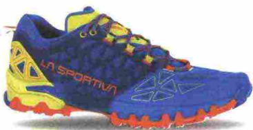
LA SPORTIVA BUSHIDO II misure: EUR da 38 a 47m - peso: g 300 - prezzo: euro 155,00

Tomaia in mesh a struttura aperta e a trama differenziata con rifiniture e protezione termosaldata a 360°. Intersuola in Profly a doppia densità. Differenziale 5 mm (18/23). Suola con inserti in gomma resistenti all'abrasione e tasselli multidirezionali. Note del produttore, categoria Hoka OneOne: Sky Trail.