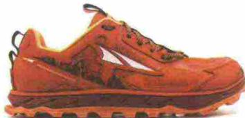
ALTRA RUNNING LONE PEAK 4.5 LOW misure: US da 5m a 11 - peso: g 247 - prezzo: euro 140,00

Tomaia in RipStop con rinforzi termosaldati e protezione in materiale sintetico sulla punta con fori di drenaggio; dotata di attacco GaiterTrap sul tallone. Allacciatura tradizionale, supportata da fascia FootLock a strappo. Intersuola in Altra EGO con piastra di protezione StoneGuard. Altezza 19 mm. Differenziale 0 mm. Suola Vibram con mescola MegaGrip Litebase e tasselli profondi 6 mm. Note del produttore : possibilità di inserimento di ghetta tramite tecnologia GaiterTrap. Categoria Altra Running: Trail.