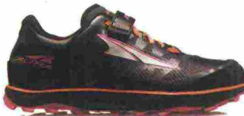
ALTRA RUNNING KING MT 2 misure: US da 5m a 11 - peso: g 206 - prezzo: euro 160,00

Tomaia realizzata senza cuciture, in mesh resistente all'abrasione con protezione termosaldata sulla punta. Allacciatura Morphit Lacing System, combinato al sistema Pull Cord per una calzata personalizzabile. Intersuola in QuikFoam a tutta lunghezza con piastra di protezione. Differenziale 9 mm (17,5/26,5). Suola in gomma resistente all'abrasione con canali di flessione QuikFlex 4Foot Engineering. Note del produttore , categoria 361°: Trail Running.