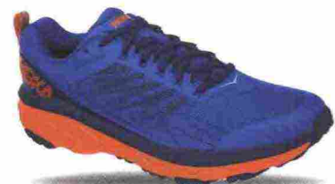
HOKA ONEONE CHALLENGER ATR 5 misure: US da 7 a 14 - peso: g 266 - prezzo: euro 140,00

Tomaia con ghetta protettiva composta da membrana water resistant DynaShell con collarino in Lycra e protezione in TPU sulla punta; Hell Preloader posizionato diagonalmente. Allacciatura a chiusura rapida con fascetta elastica fermalacci e coperta dalla ghetta chiusa da zip e fascia in Velcro. Plantare Ortholite, estraibile. Intersuola Feline UP, in EVA. Differenziale 4 mm. Suola Vibram MegaGrip LiteBase con tasselli pronunciati.