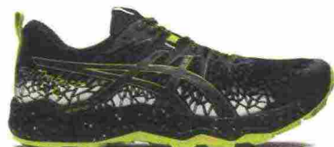
ASICS GEL FUJITRABUCO LYTE misure: US da 6 a 15 - prezzo: euro 130,00

Tomaia realizzata senza cuciture (Seamless), in Wrap-Around Knit e materiale sintetico con protezione sulla punta; dotata di attacco GaiterTrap sul tallone. Intersuola Altra Quantic con tecnologia InnerFlex. Altezza 21 mm. Differenziale 0 mm. Suola Altra MaxTrac con disegno del battistrada TrailClaw e tecnologia FootShape. Note del produttore: possibilità di inserimento di ghetta tramite tecnologia GaiterTrap. Categoria Altra Running: Trail.