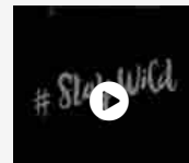
Garmont: chi siamo