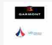
Garmont ed ENSA, una collaborazione all'innovazione