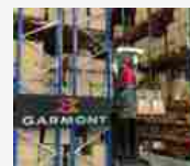
Garmont dona 1.000 paia di scarponi ai primi soccorritori