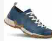
GARMONT Tikal Summer 2020

La tomaia in pelle scamosciata è dotata della tecnologia Gore-Tex® Extended Comfort capace di