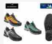
Garmont presenta Dragontail Tech GTX: performance, flessibilità e leggerezza per...