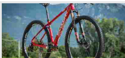
ANTEPRIMA: LEE COUGAN RAMPAGE AIR LTD FURIOUS RED