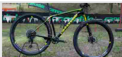
TEST & FOCUS – CANNONDALE F-SI WORLD CUP 2019

« Articolo precedente TEST IBIS RIPMO 2018