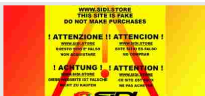
SIDI...STOP ALLE TRUFFE ON LINE !!!