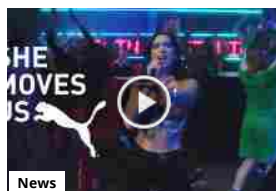
Puma: SHE MOVES US, il movimento al femminile!