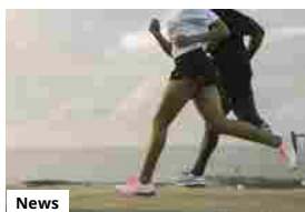
ASICS CELEBRATION OF SPORT COLLECTION