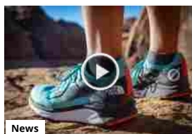
THE NORTH FACE: HAVE YOU EVER