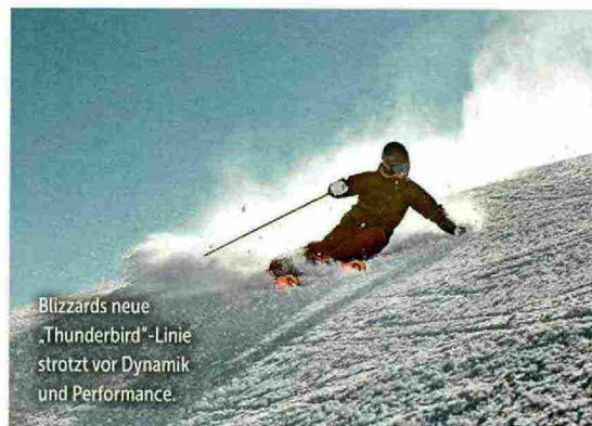
Blizzards neue ‚Thunderbird‘-Linie strotzt vor Dynamik und Performance.

Im Bereich der Pistenski sind Allmountain und performanceorientierte Vielseitigkeit Aspekte, auf die viele Hersteller setzen. Atomic, Armada und Blizzard sind da perfekte Beispiele.