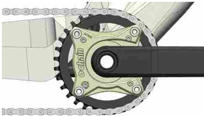
Come funziona Ochain in relazione al tiro catena della sospensione posteriore di una MTB - fonte: Ochain

Da quel momento è iniziata la fase di studio, progettazione e sviluppo di un prodotto che permettesse di guidare in modalità "chainless" senza però perdere la possibilità di pedalare, avvantaggiandosi della massiccia diffusione del sistema 1x per la corona anteriore. Dopo aver formato un gruppo di lavoro con ingegneri, appassionati e rider, si è data una struttura aziendale al progetto orientandosi a una produzione industriale di questo spider attivo . Nasce così Ochain, un componente flessibile che si adatta alla maggior parte degli standard presenti sul mercato con catene standard e BDC 104.