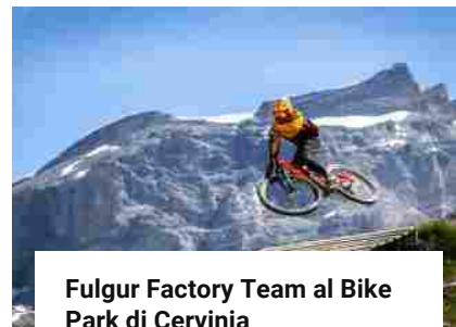
Fulgur Factory Team al Bike Park di Cervinia