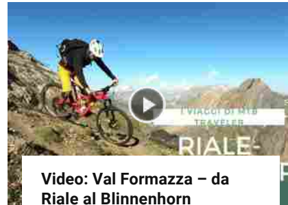
Video: Val Formazza – da Riale al Blinnenhorn