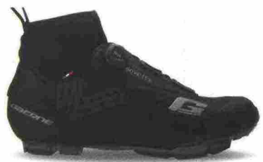
GAERNE G. ICE STORM MTB GORE-TEX misure: EUR da 39 a 48 - peso: g 448 - prezzo: euro 249,90

Tomaia in microfibra forata a laser con protezioni laterali e sulla punta; tallone anatomico. Chiusura composta da doppio rotore Boa IP1. Plantare anatomico con supporto nella zona tarsale e traforato. Suola EPS Light Mtb con struttura in fibra di carbonio e battistrada in gomma Michelin. Ramponabile. Indicata per ciclisti professionisti ed esperti. Note del produttore : disponibili le mezze misure.