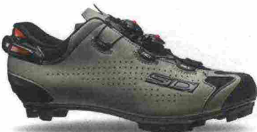
SIDI MTB TIGER 2 SRS misure: EUR da 40 a 48 - prezzo: euro 389,00

Tomaia in Politec con contrafforte rinforzato. Chiusura composta da meccanismo micrometrico Tecno-3 System. Plantare sagomato, removibile. Suola Mtb Competition, in nylon e poliuretano. Ramponabile. Indicata per il ciclista di buon livello tecnico.