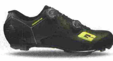
GAERNE CARBON G. SINCRO misure: EUR da 39 a 47 - peso: g 348 - prezzo: euro 339,90

Tomaia in microfibra forata a laser con stabilizzatore tallonare integrato. Chiusura composta da doppio rotore Boa IP-1. Plantare anatomico con supporto nella zona tarsale e traforato. Suola EPS Light Mtb con struttura in fibra di carbonio e battistrada in gomma Michelin. Ramponabile. Indicata per ciclisti professionisti ed esperti. Note del produttore : disponibile anche con suola EPS Carbon Power Mtb con struttura in nylon rinforzata in fibra di carbonio.