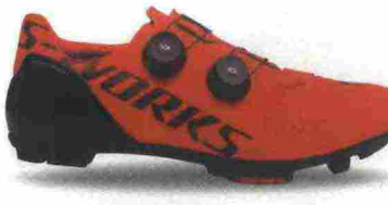
SPECIALIZED S-WORKS RECON misure: EUR da 37 a 47 - peso: g 270 - prezzo: euro 381,00

Tomaia in materiale termoplastico (TPU), termosaldato, microforato e indeformabile con protezione sulla punta; contrafforte tallonare rinforzato. Chiusura composta da doppio rotore Boa LP6 e supportata da fascia in Velcro. Plantare sviluppato con tecnologia Body Geometry dal design ergonomico. Suola in nylon stampata ad iniezione con tecnologia Stride Toe-Flex con battistrada in gomma SlipNot. Indicata per ciclisti di medio e alto livello tecnico.