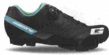
GAERNE G. HURRICANE LADY misure: EUR da 37 a 43 - peso: g 318 - prezzo: euro 159,90

Tomaia in microfibra forata a laser con stabilizzatore tallonare integrato. Chiusura composta da rotore Boa System L6. Plantare anatomico con supporto nella zona tarsale e traforato. Suola Mtb 2Density (doppia densità), in nylon e fibra di vetro. Indicata per atlete di medio e alto livello tecnico.