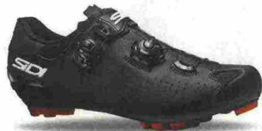
SIDI MTB EAGLE 10 misure: EUR da 36 a 48 - prezzo: euro 229,00

Tomaia in microfibra TechPro effetto opaco con tallone tecnico regolabile sullo spoiler. Chiusura composta dal Soft Instep Closure System 4 con meccanismo micrometrico Tecno-3 Push e Single Tecno-3 Push; tutti sostituibili. Plantare sagomato e removibile. Suola Mtb SRS Carbon Ground, in carbonio con inserti in poliuretano facilmente sostituibili. Ramponabile. Indicata per atleti professionisti e ciclisti di alto livello tecnico.