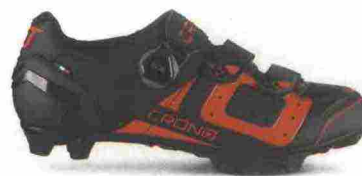
CRONO CX-3 misure: EUR da 37 a 48 - prezzo: euro 139,00

Tomaia in microfibra forata a laser tramite sistema LAS e con inserti anteriori in mesh; stabilizzatore tallonare integrato e rinforzato in TPU. Chiusura composta da doppio rotore micrometrico Boa L6 con cavo in acciaio rivestito. Plantare anatomico con inserti ammortizzanti SAS (Shock Absorption System). Suola Mtb Carbon Composit, in nylon rinforzato da carbonio. Ramponabile. Indicata per ciclisti professionisti e di alto livello tecnico.