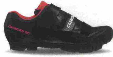
GAERNE G. LASER LADY misure: EUR da 36 a 43 - peso: g 326 - prezzo: euro 109,90

Tomaia in microfibra forata a laser con stabilizzatore tallonare integrato. Chiusura composta da rotore Boa System L6. Plantare anatomico con supporto nella zona tarsale e traforato. Suola Mtb 2Density (doppia densità), in nylon e fibra di vetro. Indicata per atlete di medio e alto livello tecnico.