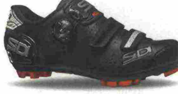
SIDI MTB TRACE 2 WOMAN misure: EUR da 36 a 42 - prezzo: euro 169,00

Tomaia in microfibra forata a laser con stabilizzatore tallonare integrato. Chiusura composta da tripla fascia in Velcro. Plantare anatomico con supporto nella zona tarsale e traforato. Suola Mtb 2Density (doppia densità), in nylon e fibra di vetro. Indicata per chi si avvicina al mondo del ciclismo.