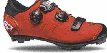
SIDI MTB DRAGON 5 SRS MATT misure: EUR da 39 a 48 - prezzo: euro 279,00

Tomaia in microfibra TechPro effetto opaco con parti forate. Chiusura composta dal Soft Instep Closure System 4 con meccanismo micrometrico Tecno-3 Push and Single Tecno-3 Push; tutti sostituibili. Plantare sagomato e removibile. Suola Mtb SRS Carbon Ground, in carbonio con inserti in poliuretano facilmente sostituibili. Ramponabile. Indicata per atleti professionisti e ciclisti di alto livello tecnico.