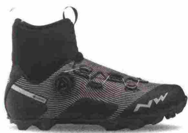
NORTHWAVE CELSIUS XC GTX misure: EUR da 39m a 45m - peso: g 442 - prezzo: euro 219,99

Tomaia assemblata con struttura a sovrapposizione, in materiale poliuretano con rinforzi e protezioni in TPU e membrana Koala Gore-Tex; collarino Easyfit Climaflex in neoprene con membrana Gore-Tex Rattler. Chiusura composta da rotore SLW2 con rilascio graduale. Sottopiede Arctic, in EVA a quattro strati con isolamento termico in alluminio e pile. Suola Jaws, rinforzata in carbonio con battistrada in gomma naturale. Ramponabile. Indicata per atleti di alto livello tecnico, che sfidano la stagione più fredda.