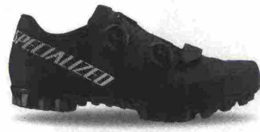
SPECIALIZED RECON 3.0 MOUNTAIN misure: EUR da 39 a 47 - peso: g 357 - prezzo: euro 219,00

Tomaia termoformata, in materiale sintetico e termoplastico (TPU) microforato; contrafforte tallonare rinforzato. Chiusura composta da rotore Boa IP1 e supportata da fascia in Velcro. Plantare sviluppato con la tecnologia Body Geometry dal design ergonomico. Suola in fibra di carbonio con battistrada in gomma antiscivolo SlipNot. Ramponabile. Indicata per ciclisti di medio e alto livello tecnico.