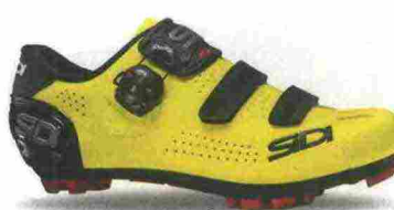
SIDI MTB TRACE 2 misure: EUR da 36 a 48 - prezzo: euro 169,00

Tomaia in microfibra TechPro effetto opaco con inserti in mesh, contrafforte integrato e meccanismo regolabile sul tallone con inserti Reflex catarifrangenti. Chiusura composta da doppio meccanismo micrometrico Tecno-3 Push Flex, sostituibili. Plantare sagomato, estraibile. Suola Mtb SRS Carbon Ground, in carbonio con inserti in poliuretano facilmente sostituibili. Ramponabile. Indicata per atleti professionisti e ciclisti di alto livello tecnico.