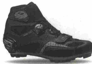
SIDI MTB FROSSTE GORE 2 misure: EUR da 39 a 48 - prezzo: euro 249,00

Tomaia in microfibra Microtech effetto opaco con inserti in mesh. Chiusura composta dal Soft Instep Closure System 4, doppio meccanismo micrometrico Tecno-3 System. Plantare sagomato, removibile. Suola Mtb SR 17, in nylon con inserti in poliuretano e con puntale sostituibile. Ramponabile. Indicata per atleti di medio e alto livello tecnico.