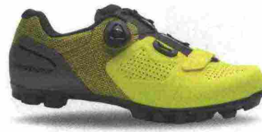
SPECIALIZED EXPERT XC MOUNTAIN misure: EUR da 39 a 47 - prezzo: euro 222,00

Tomaia in Politec con contrafforte rinforzato. Chiusura composta da meccanismo micrometrico Tecno-3 e Soft Instep Closure System, supportata da doppio cinturino in Velcro. Plantare sagomato, removibile. Suola Mtb SR 17, in nylon con inserti in poliuretano e con puntale sostituibile. Ramponabile. Indicata per il ciclista di buon livello tecnico.