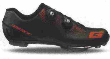
GAERNE CARBON G. KOBRA misure: EUR da 39 a 47 - peso: g 341 - prezzo: euro 289,90

Tomaia in microfibra forata a laser con tallone integrato. Chiusura composta da rotore Boa System L6. Plantare anatomico con supporto nella zona tarsale e traforato. Suola EPS Light Mtb con struttura in fibra di carbonio e battistrada in gomma Michelin. Ramponabile. Indicata per atleti di medio e alto livello tecnico. Note del produttore : disponibile anche con suola Mtb 2Density, in nylon e fibra di vetro.