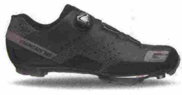
GAERNE CARBON G. HURRICANE misure: EUR da 39 a 47 - peso: g 321 - prezzo: euro 199,90

Tomaia in materiale poliuretano con fori di areazione. Chiusura composta da tripla fascia in Velcro. Plantare in EVA perforata e lavabile. Suola in nylon e fibra di vetro con battistrada in gomma antiscivolo. Ramponabile. Indicata per ciclisti principianti o di medio livello tecnico.