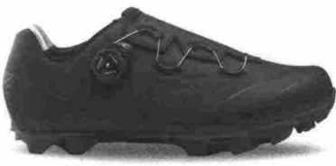
NORTHWAVE MAGMA XC ROCK misure: EUR da 39m a 45m - peso: g 410 - prezzo: euro 164,99

Tomaia assemblata con costruzione Overlap, in materiale poliuretano con rinforzi e protezioni in TPU e collarino Easyfit Climaflex in neoprene; foderata con isolante termico Primaloft Bio. Chiusura composta da rotore SLW2 con rilascio graduale. Sottopiede Arctic, in EVA a quattro strati con isolamento termico in alluminio e pile. Suola Jaws, rinforzata in carbonio con battistrada in gomma naturale. Ramponabile. Indicata per atleti di medio livello tecnico, che sfidano la stagione più fredda.