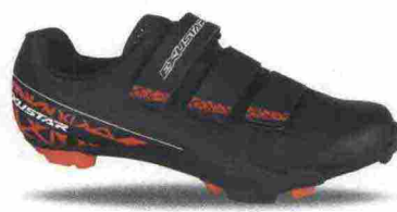
EXUSTAR E-SM3310-RD misure: EUR da 37 a 48 - peso: g 370

Tomaia in materiale poliuretano con fori di areazione. Chiusura composta da leva micrometrica Microlock e da doppia fascia in Velcro. Plantare in EVA perforata e lavabile. Suola in nylon e fibra di vetro con battistrada in gomma antiscivolo. Ramponabile. Indicata per ciclisti di medio e alto livello tecnico.