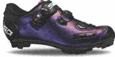
SIDI JARIN misure: EUR da 40 a 48 - prezzo: euro 389,00

Tomaia assemblata con costruzione a sovrapposizione, in materiale poliuretano con protezione in TPU sulla punta; foderata con isolante termico Primaloft Bio. Chiusura composta da rotore SLW2 con rilascio graduale. Sottopiede Arctic, in EVA a quattro strati con isolamento termico in alluminio e pile. Suola Jaws, rinforzata in carbonio con battistrada in gomma naturale. Ramponabile. Indicata per atleti di medio livello tecnico, che sfidano la stagione più fredda.