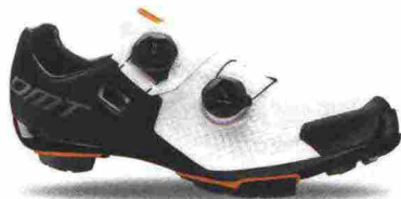
DMT MH1 misure: EUR da 37 a 47 - peso: g 300 - prezzo: euro 290,00

Tomaia ingegnerizzata, in Knit 3D e materiale sintetico con protezione sulla punta. Chiusura composta da doppio rotore Boa IP1. Plantare anatomico, in polipropilene con fori di areazione. Suola in carbonio unidirezionale con inserti in gomma. Indicata per atleti professionisti e ciclisti esperti. Note del produttore: gli inserti in gomma della suola sono stati studiati e realizzati in collaborazione con Michelin.