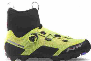
NORTHWAVE CELSIUS XC ARTIC GTX misure: EUR da 39m a 45m - peso: g 445 - prezzo: euro 249,99

Tomaia ingegnerizzata, in Knit 3D e materiale sintetico con protezione sulla punta. Chiusura composta da doppio rotore Boa IP1. Plantare anatomico, in polipropilene con fori di areazione. Suola in carbonio unidirezionale con inserti in gomma. Indicata per atleti professionisti e ciclisti esperti. Note del produttore: gli inserti in gomma della suola sono stati studiati e realizzati in collaborazione con Michelin.