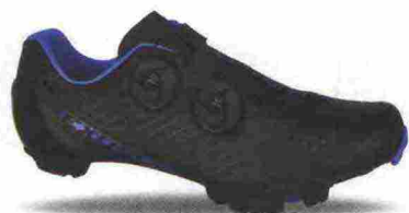
EXUSTAR E-SM3011 misure: EUR da 37 a 48 - peso: g 295

Tomaia realizzata con costruzione Smooth Form (senza cuciture), in materiale poliuretano con fori di areazione e vasta protezione in TPU sulla punta. Chiusura composta da rotore Atop Microlock e supportata da doppia fascia in Velcro. Plantare in EVA, lavabile. Suola in nylon e fibra di vetro con battistrada in gomma antiscivolo. Ramponabile. Indicata per atleti di medio e alto livello. Note del produttore , categoria Exustar: Mtb Comp.