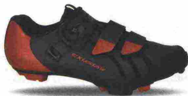
EXUSTAR E-SM3010 misure: EUR da 37 a 48 - peso: g 363

Tomaia in microfibra sintetica con stabilizzatore tallonare integrato e rinforzato in TPU. Chiusura composta da tripla fascia in Velcro. Plantare anatomico. Suola Mtb Carbon Composit, in nylon rinforzata da carbonio. Indicata per il ciclista di livello amatoriale.