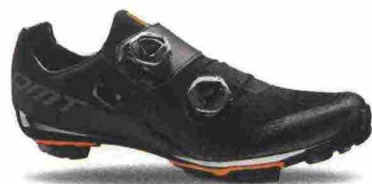
DMT MH1 misure: EUR da 37 a 47 - peso: g 300 - prezzo: euro 290,00

Tomaia ingegnerizzata, in Knit con applicazioni antiusura termosaldate e protezione sulla punta. Chiusura composta da rotore Boa IP1. Plantare in polipropilene con fori di areazione. Suola in carbonio Toray MR60 con tacchetti intercambiabili. Indicata per atleti di medio e alto livello.