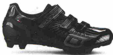
CRONO CX-4 misure: EUR da 37 a 48 - prezzo: euro 99,90

Tomaia in microfibra sintetica con stabilizzatore tallonare integrato e rinforzato in TPU. Chiusura composta da tripla fascia in Velcro. Plantare anatomico. Suola Mtb Carbon Composit, in nylon rinforzata da carbonio. Indicata per il ciclista di livello amatoriale.