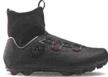
NORTHWAVE MAGMA XC CORE misure: EUR da 39m a 45m - peso: g 420 - prezzo: euro 189,99

Tomaia assemblata con struttura X-Frame, in microfibra con protezione in gomma a 360° e membrana Gore-Tex Duratherm Kelvin; collarino Easyfit Climaflex in neoprene con membrana Gore-Tex Rattler. Chiusura composta da rotore SLW2 con rilascio graduale. Sottopiede Arctic, in EVA a quattro strati con isolamento termico in alluminio e pile. Suola Carbon XC12, in carbonio con inserti in TPU posizionati strategicamente. Ramponabile. Indicata per atleti professionisti e ciclisti esigenti, che sfidano la stagione più fredda.