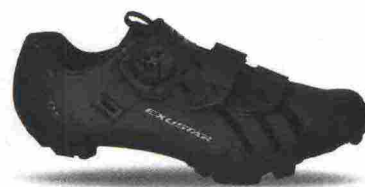
EXUSTAR E-SM3010-BK misure: EUR da 37 a 48 - peso: g 363

Tomaia realizzata con costruzione Smooth Form (senza cuciture), in materiale poliuretano con fori di areazione e vasta protezione in TPU sulla punta. Chiusura composta da rotore Atop Microlock e supportata da doppia fascia in Velcro. Plantare in EVA, lavabile. Suola in nylon e fibra di vetro con battistrada in gomma antiscivolo. Ramponabile. Indicata per atleti di medio e alto livello. Note del produttore , categoria Exustar: Mtb Comp.