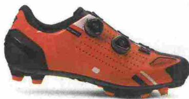
CRONO CX-2 misure: EUR da 37 a 48 - prezzo: euro 239,00

Tomaia in Lycra idrorepellente con sovrainiezione in gomma e stabilizzatore tallonare integrato e rinforzato in TPU; membrana WindTex e foderia termica. Chiusura composta da lacci, nascosti da zip idrorepellente e supportata da fascia in Velcro alla caviglia. Plantare anatomico. Suola Carbon Composit, in nylon rinforzata con carbonio. Disponibile anche in versione Strada. Indicata per condizioni atmosferiche estreme è destinata al ciclista di buon livello tecnico.