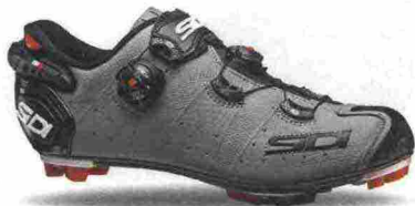
SIDI MTB DRAKO 2 SRS MATT misure: EUR da 39 a 48 - prezzo: euro 355,00

Tomaia in microfibra TechPro effetto opaco con tallone tecnico regolabile sullo spoiler. Chiusura composta dal Soft Instep Closure System 4 con meccanismo micrometrico Tecno-3 Push e Single Tecno-3 Push; tutti sostituibili. Plantare sagomato e removibile. Suola Mtb SRS Carbon Ground, in carbonio con inserti in poliuretano facilmente sostituibili. Ramponabile. Indicata per atleti professionisti e ciclisti di alto livello tecnico.