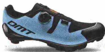
DMT KM3 misure: EUR da 37 a 48 - peso: g 285 - prezzo: euro 215,00

Tomaia ingegnerizzata, in Knit 3D con applicazioni antiusura termosaldate e protezione in gomma sulla punta. Chiusura composta da rotore Boa IP1. Plantare anatomico, in polipropilene con fori di areazione. Suola in carbonio unidirezionale con inserti in gomma. Indicata per atleti professionisti e ciclisti esperti. Note del produttore: gli inserti in gomma della suola sono stati studiati e realizzati in collaborazione con Michelin.