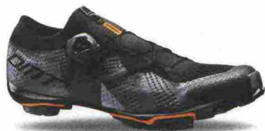
DMT KM1 misure: EUR da 37 a 48 - peso: g 295 - prezzo: euro 349,00

Tomaia ingegnerizzata, in Knit 3D con applicazioni antiusura termosaldate e protezione in gomma sulla punta. Chiusura composta da rotore Boa IP1. Plantare anatomico, in polipropilene con fori di areazione. Suola in carbonio unidirezionale con inserti in gomma. Indicata per atleti professionisti e ciclisti esperti. Note del produttore: gli inserti in gomma della suola sono stati studiati e realizzati in collaborazione con Michelin.