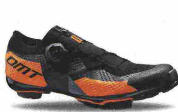
DMT KM1 misure: EUR da 37 a 48 - peso: g 295 - prezzo: euro 349,00

Tomaia in microfibra forata a laser con tallone integrato. Chiusura composta da tripla fascia in Velcro. Plantare anatomico con supporto nella zona tarsale e traforato. Suola Mtb 2Density (doppia densità), in nylon e fibra di vetro. Indicata per chi si avvicina al mondo del ciclismo.