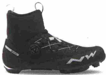
NORTHWAVE EXTREME XC GTX misure: EUR da 39m a 45m - peso: g 445 - prezzo: euro 299,99

Tomaia assemblata con struttura a sovrapposizione, in materiale poliuretano con rinforzi e protezioni in TPU e membrana Pique Gore-Tex; collarino Easyfit Climaflex in neoprene con membrana Gore-Tex Rattler. Chiusura composta da rotore SLW2 con rilascio graduale. Sottopiede Arctic, in EVA a quattro strati con isolamento termico in alluminio e pile. Suola Jaws, rinforzata in carbonio con battistrada in gomma naturale. Ramponabile. Indicata per atleti di medio e alto livello tecnico, che sfidano la stagione più fredda.