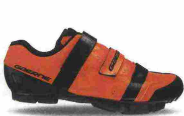
GAERNE G. LASER misure: EUR da 37 a 48 - peso: g 382 - prezzo: euro 109,90

Tomaia in microfibra G. Active Airflow con rinforzi antiabrasione (laterali e punta) e con inserti catarifrangenti Reflex; collarino elasticizzato in Gore-Tex Rattler e membrana Gore-Tex Duratherm. Chiusura composta da rotore Boa IP-1. Plantare anatomico con supporto nella zona tarsale. Intersuola isolante, con l'aggiunta di alluminio termo-riflettente, in grado di creare una barriera termica. Suola Mtb, in nylon e fibra di vetro con battistrada in gomma. Ramponabile. Indicata per un uso invernale, in condizioni climatiche rigide.