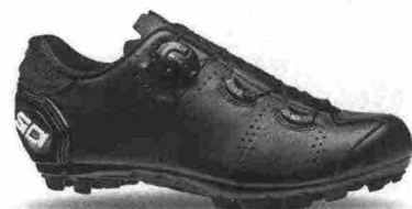
SIDI MTB SPEED misure: EUR da 38 a 48 - prezzo: euro 179,00

Tomaia in microfibra Microtech con protezione sulla punta e contrafforte rinforzato; membrana idrorepellente e traspirante Gore-tex. Chiusura composta dal meccanismo micrometrico Tecno-3, supportato da cinturino in Velcro (parte anteriore) e da un'ampia fascia in Velcro alla caviglia. Plantare in feltro, sagomato e removibile. Suola Mtb SR 17, in nylon con inserti in poliuretano e con puntale sostituibile. Ramponabile. Indicata per sfidare la stagione più fredda o le giornate piovose.