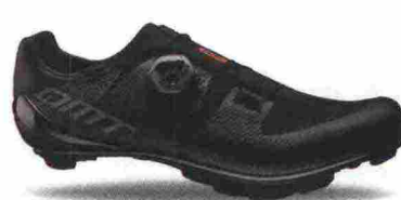
DMT KM3 misure: EUR da 37 a 48 - peso: g 285 - prezzo: euro 215,00

Tomaia ingegnerizzata, in Knit con applicazioni antiusura termosaldate e protezione sulla punta. Chiusura composta da rotore Boa IP1. Plantare in polipropilene con fori di areazione. Suola in carbonio Toray MR60 con tacchetti intercambiabili. Indicata per atleti di medio e alto livello.