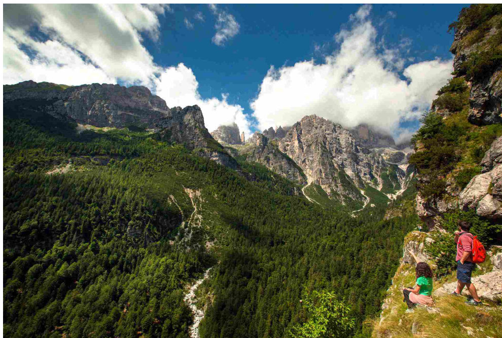
Trekking al Croz de l'Altissimo, nel comprensorio Dolomiti Paganella

Preparare lo zaino da trekking è un'arte che si migliora con il tempo, perfezionabile con esperienze ed errori. Speriamo, con questa breve guida, di avervi accompagnato in quello che sarà il vostro prossimo trekking.