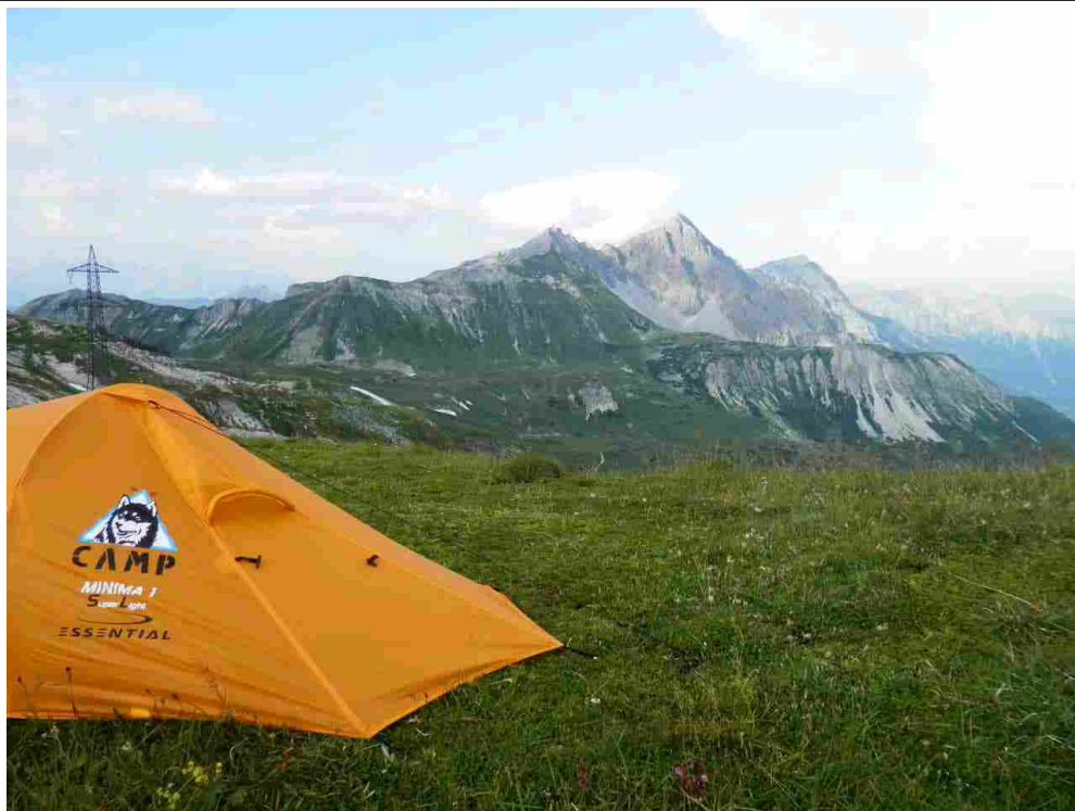
Camp Minima SL1, tenda super leggera

Il secondo step è la scelta della tenda . Per un trekking di più giorni è fondamentale che la tenda sia piccola e leggera. In commercio esistono moltissime tipologie, in generale si utilizzano tende tre-stagioni con una buona impermeabilità. Il peso di una tenda di questo tipo per due persone oscilla tra 1,3 kg e 2,5 kg. Le tende più leggere spesso non sono autoportanti poiché impiegano una paleria ridotta; ciò significa che non sarebbe possibile montare la tenda senza l'uso dei picchetti. È una caratteristica sulla quale è bene ponderare la scelta con la dovuta attenzione, soprattutto nel caso si abbia intenzione di pernottare su sabbia o su terreno roccioso.