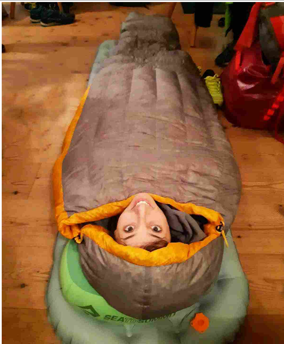
Estate 2020, proviamo i sacchi a pelo

La scelta del sacco a pelo e del materassino dipende molto dalla stagione e dall'altitudine. In generale anche il migliore sacco a pelo senza un buon materassino che isoli da freddo ed umidità potrebbe essere cause di notti insonni. Per un trekking di questo tipo, i materassini più utilizzati sono quelli in schiuma e gonfiabili. I materassini auto-gonfianti, sebbene siano tra i più comodi e isolanti, hanno spesso un peso eccessivo e poco adatto ad un'attività di questo tipo.