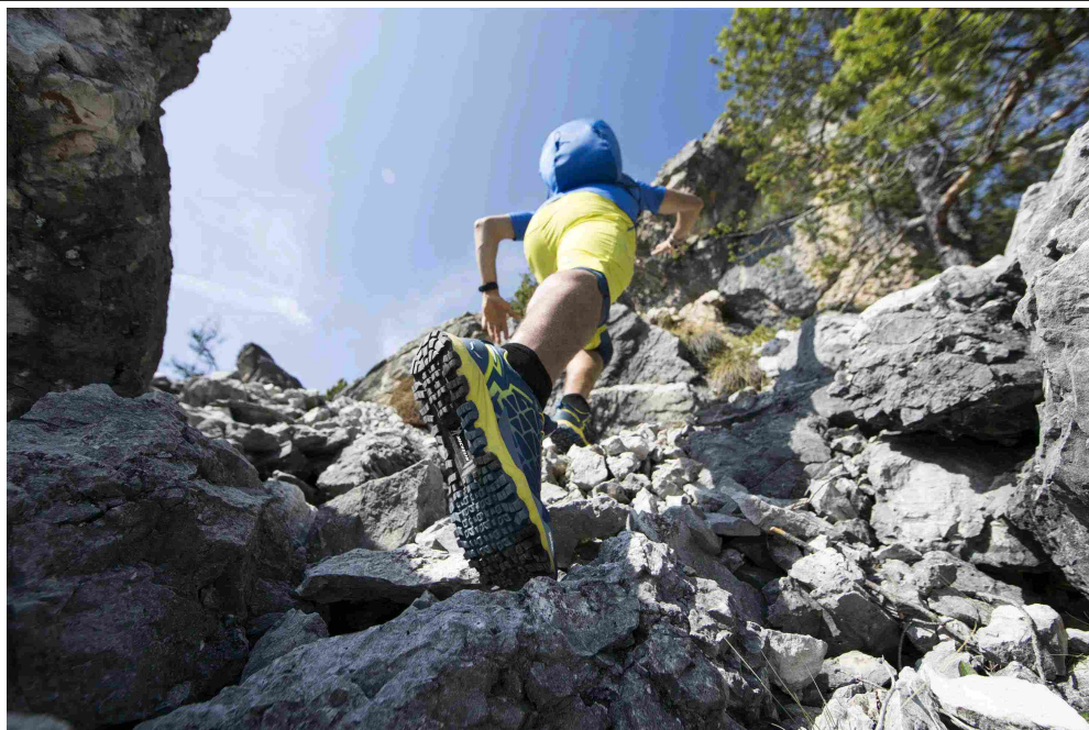
Trekking veloce con le soles Michelin

Le scarpe da trekking meritano un proprio spazio di discussione. La scelta è ampia e molto personale: scarpe alte per proteggere le caviglie, basse per una mobilità migliore non rinunciando all'impermeabilità, l'opzione trail-running per privilegiare il comfort... ve ne sono diverse e per ogni occasione.