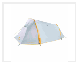
Tenda Lightent Pro 2 Ferrino