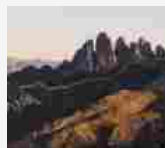
Inizia la sfida Mammut Local Adventure! 16 GIUGNO 2020