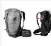
MAMMUT Zaino Duncan Spine Summer 2020 21 OTTOBRE 2020