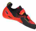
LA SPORTIVA ZENIT WINTER...