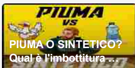
6 mesi fa · 1 commento PREMESSA: COME I MATERIALI ISOLANTI CI TENGONO CALDO? Il ...