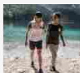
Mammut celebra la milionesima T-Shirt CO2 free in cotone biologico 6 LUGLIO 2020