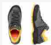
MAMMUT Alasca II Low GTX ... 21 OTTOBRE 2020