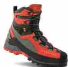
GARMONT TOWER 2.0 GTX®