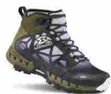
GARMONT 981 N.A.I.R.G. SURROUND GTX