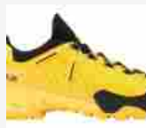
MAMMUT Alasca Knit II Low Summer... 21 OTTOBRE 2020