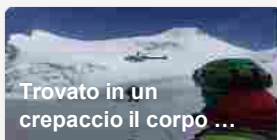
un anno fa · 2 commenti Il ritrovamento è avvenuto grazie all'individuazione di una traccia nella neve Il ...