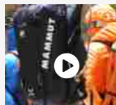
Mammut Trion Nordwand, Taiss Pro e Sonda 240 Speed Lock... 19 FEBBRAIO 2020