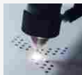
Mammut ottiene lo 'Stato di Leader' dalla fondazione... 1 LUGLIO 2020