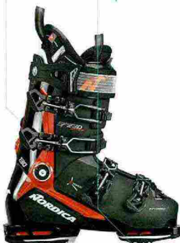
*MP: Mondo Point

Michelin-GripWalk-Sohle liegt eine Alpin-Sohle bei