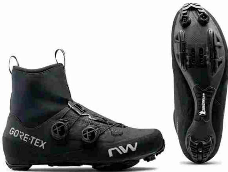
Northwave Flagship GTX - 399,99 €

Nata per celebrare i 15 anni di collaborazione tra Northwave e Gore-Tex , due brand che rappresentano delle vere e proprie eccellenze nello studio di soluzioni che sfidano il gelo. Una partnership solida che racconta come la sinergia dei migliori tecnici di Gore-Tex con i designer Northwave Lab si concretizzano nei migliori prodotti per il consumatore.