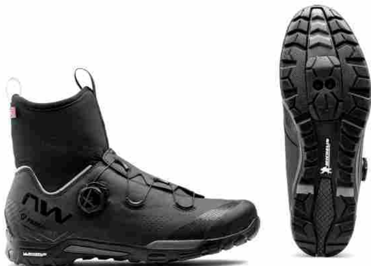
Northwave X-Magma Core - 189,99 €

Le nuove scarpe invernali sviluppate per tutti i tipi di trail , consigliate anche per l'e-bike . La suola Explorer garantisce una trasmissione della potenza nell'area del pedale e il battistrada, sviluppato da JV International e marchiate Michelin , garantiscono maggior resistenza (+28%) rispetto al TPU e un'aderenza eccellente su tutti i terreni. L' imbottitura termica Primaloft da 200 g ECO derivata da materiale riciclato, garantisce un eccezionale isolamento termico e traspirabilità.