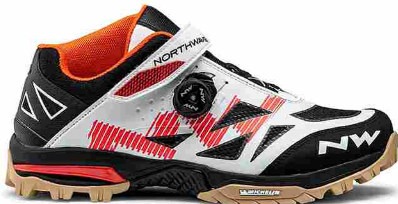
Northwave Enduro MID con suola Michelin