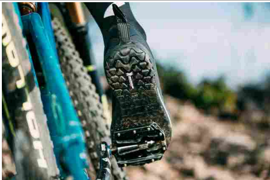
La suola Gecko+ delle scarpe Northwave Clan sviluppata in collaborazione con Michelin Soles

"Le soles a marchio Michelin sono customizzate ad hoc per ognuno dei nostri partner per soddisfare le esigenze del consumatore. Abbiamo sviluppato molteplici soles per più di 50 finalità d'uso; dal running al fashion, dal work & safety alla mountain bike, dal kids all'outdoor. Si tratta di un numero importante, raggiunto in pochi anni, e che trova oggi in #technostories.com un suo luogo di comunicazione ed identità."