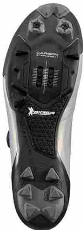
Suola specifica per XC sviluppata da Michelin Soles per Shimano XC9

Da anni JV International , licenziatario mondiale esclusivo per la progettazione e produzione di suole a marchio Michelin ( qui la nostra presentazione ), sfrutta il know-how del contatto con il suolo del produttore di fama mondiale, per trasferire nelle suole le performance e tecnologie che troviamo negli pneumatici.