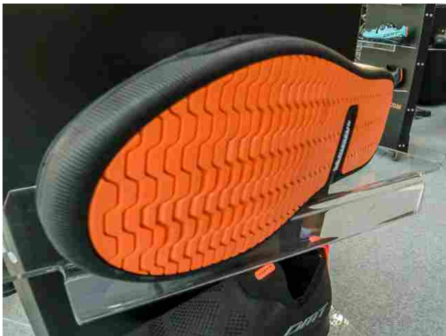
DMT FK1, scarpe per pedali flat con suola sviluppata in collaborazione con Michelin