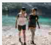
Mammut celebra la milionesima T-Shirt CO2 free in cotone biologico 6 LUGLIO 2020