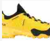
MAMMUT Alnasca Knit II Low Summer... 21 OTTOBRE 2020