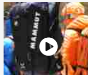
Mammut Trion Nordwand, Taiss Pro e Sonda 240 Speed Lock... 19 FEBBRAIO 2020