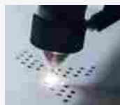
Mammut ottiene lo "Stato di Leader" dalla fondazione... 1 LUGLIO 2020