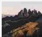
Inizia la sfida Mammut Local Adventure! 16 GIUGNO 2020