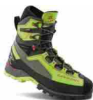
GARMONT TOWER 2.0 EXTREME GTX®