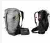
MAMMUT Zaino Ducan Spine Summer 2020 21 OTTOBRE 2020