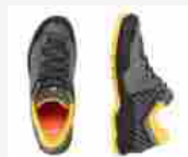
MAMMUT Alnasca II Low GTX ... 21 OTTOBRE 2020