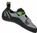
LA SPORTIVA ARAGON WINTER 2020.21