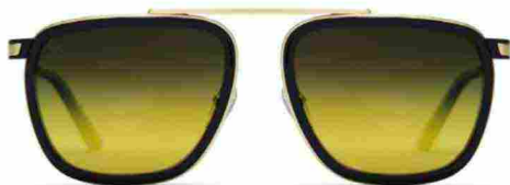
Modello Saturno con lente nero sfumato oro in Polar Platinum Glass, Barberini, € 370. barberinieyewear.it

Far vagare lo sguardo nelle immensità del deserto o ammirare i guizzi dell'aurora boreale. Per farsi abbagliare solo dalla meraviglia, e non dai raggi nocivi, Barberini monta sugli occhiali lenti in vetro ottico Platinum Glass dalle performance protettive inalterabili anche in condizioni estreme. Proprio agli elementi naturali sono ispirate le nuove colorazioni specchiate e sfumate, avvolte da cornici metalliche o in acetato stile voyager. (S.A.)