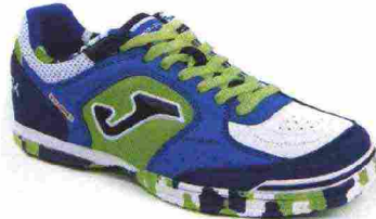
JOMA TOP FLEX IN misure: EUR da 36 a 47 - peso: g 270 - prezzo: euro 79,00

Tomaia in nylon mesh e microfibra con rinforzi termosaldati in TPU; puntalino di protezione in TPU sulla punta; sistema di ventilazione VTS. Allacciatura tradizionale. Plantare sagomato in EVA. Intersuola in Phylon con profondi intagli di flessione. Suola in gomma con tecnologia Flexo. Indicata per giocatori di medio e alto livello tecnico.