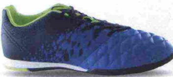
KIPSTA AGILITY 500 misure: EUR da 39 a 47 - prezzo: euro 26,99

Tomaia in pelle di vitello pieno fiore con inserti in mesh e rinforzi in suede su punta e tallone; puntalino di protezione in TPU sulla punta. Allacciatura tradizionale, con linguetta in mesh. Plantare sagomato in EVA. Intersuola in Phylon. Suola in gomma resistente all'abrasione DIN-70 con tecnologia Rotation e Flexo. Indicata per giocatori di medio e alto livello tecnico.