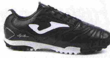
JOMA AGUILA GOL TF misure: EUR da 39 a 47 - peso: g 233 - prezzo: euro 64,00

Tomaia in pelle di vitello pieno fiore (anteriore) e materiale sintetico con protezione in microfibra sulla punta; contrafforte tallonare Rearfoot Stabilizer. Allacciatura tradizionale. Plantare sagomato in EVA, trasparente ed estraibile. Intersuola in EVA espansa con tecnologia XG. Suola non-marking, in gomma con tassellatura a elementi geometrici eterogenei. Indicata per giocatori di medio e alto livello tecnico. Note del produttore: la pelle pieno fiore utilizzata per la realizzazione della tomaia è italiana.