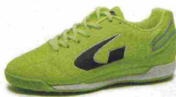
GEMS TIGER EVO misure: EUR da 36 a 46 - peso: g 270 - prezzo: euro 55,00

Tomaia in materiale poliuretano con doppie cuciture di rinforzo sull'avampiede. Allacciatura tradizionale. Plantare sagomato in EVA, trasparente ed estraibile. Intersuola in EVA espansa con tecnologia XG e inserto Arch Block in TPU a sostegno dell'arco plantare. Suola non-marking, in gomma con tassellatura Dotted Hell. Indicata per giocatori di qualsiasi livello tecnico.