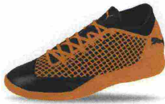
PUMA FUTURE 2.4 IT misure: UK da 6 a 12 - prezzo: euro 50,00

Tomaia realizzata su struttura slip-on, in mesh con protezioni e rinforzi termosaldati. Allacciatura con stringhe trattenute dalla tecnologia FuseFit con 6 supporti laterali, per una chiusura personalizzabile. Plantare sagomato in EVA, estraibile. Intersuola in Ignite Foam. Suola in gomma, ad alta trazione. Indicata per atleti di medio e alto livello tecnico.