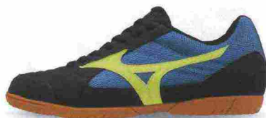
MIZUNO SALA CLUB 2 IN misure: US da 4m a 13 - peso: g 250 - prezzo: euro 55,00

Tomaia in materiale sintetico (anteriore) con doppie cuciture di rinforzo e nylon mesh, protezioni su punta e tallone. Allacciatura tradizionale, con linguetta in mesh. Plantare in EVA. Suola in gomma naturale con disegno antiscivolo. Indicata per giocatori di qualsiasi livello tecnico.