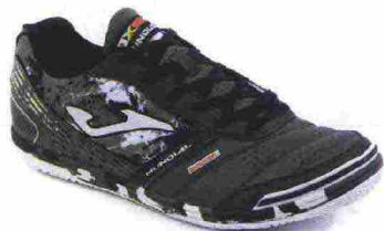
JOMA MUNDIAL IN misure: EUR da 39 a 47 - peso: g 310 - prezzo: euro 56,00

Tomaia in Fibertech con doppie cuciture di rinforzo e con puntalino di protezione sulla punta. Allacciatura tradizionale, con linguetta in mesh. Plantare in EVA termofornata. Suola in gomma naturale resistente all'abrasione DIN-70 con tecnologia Rotation. Indicata per giocatori di qualsiasi livello tecnico.