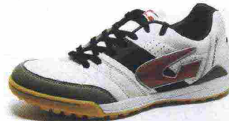
GEMS VERTIGO FX misure: EUR da 39 a 46 - prezzo: euro 95,00

Indicata per giocatori di medio e alto livello tecnico.