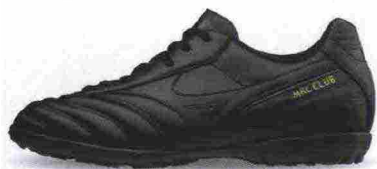
MIZUNO MRL CLUB AS misure: US da 7 a 13 - peso: g 275 - prezzo: euro 55,00

Tomaia in materiale sintetico con doppie cuciture di rinforzo e leggera imbottitura sull'avampiede. Allacciatura tradizionale, con stringhe piatte. Plantare in EVA. Suola in gomma, multitacchettata. Indicata per giocatori di qualsiasi livello tecnico.