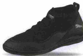
PUMA 365 FF 3 CT misure: UK da 6 a 12 - prezzo: euro 50,00

Tomaia in materiale sintetico (anteriore) con doppie cuciture di rinforzo e nylon mesh, protezioni su punta e tallone. Allacciatura tradizionale, con linguetta in mesh. Plantare in EVA. Suola in gomma naturale con disegno antiscivolo. Indicata per giocatori di qualsiasi livello tecnico.