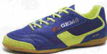
GEMS BLADE misure: EUR da 36 a 46 - peso: g 263 - prezzo: euro 65,00

Indicata per giocatori di medio e alto livello tecnico.