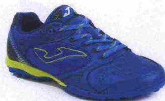
JOMA DRIBLING TF misure: EUR da 39 a 47 - peso: g 274 - prezzo: euro 45,00

Tomaia realizzata senza cuciture, in Micro poliuretano con calzino integrato in maglia. Allacciatura tradizionale. Plantare in EVA. Suola in gomma multiacchettata. Indicata per giocatori di qualsiasi livello tecnico.