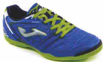
JOMA MAXIMA IN misure: EUR da 39 a 47 - peso: g 257 - prezzo: euro 39,90

Tomaia in Fibertech e nylon mesh con puntalino di protezione in gomma sulla punta; sistema di ventilazione VTS. Allacciatura tradizionale, con linguetta in mesh. Plantare in EVA termofornata. Intersuola in Phylon con sistema Pulsor: inserti ammortizzanti in Gel posizionati sia nella zona tallonare sia nell'avampiede. Suola in gomma, resistente all'abrasione DIN-70 con tecnologia Rotation. Indicata per giocatori di qualsiasi livello tecnico.