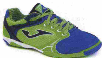
JOMA DRIBLING IN misure: EUR da 39 a 47 - peso: g 293 - prezzo: euro 45,00

Tomaia in pelle di vitello pieno fiore (anteriore) e materiale sintetico con protezione in microfibra sulla punta; contrafforte tallonare Rearfoot Stabilizer. Allacciatura tradizionale. Plantare sagomato in EVA, traspirante ed estraibile. Intersuola in EVA espansa con tecnologia XG. Suola non-marking, in gomma naturale con inserti a doppia densità. Indicata per giocatori di medio e alto livello tecnico.