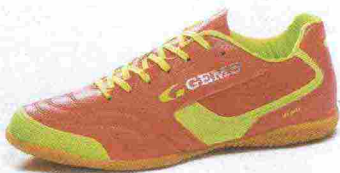
GEMS BLADE misure: EUR da 36 a 46 - peso: g 263 - prezzo: euro 65,00

INDOOR - Calzature caratterizzate dal battistrada liscio e dal disegno tipico degli sport con importanti e frequenti cambi di direzione e velocità, in modo da non rovinare il pavimento in linoleum, parquet o gomma, ma senza rinunciare a una buona aderenza.