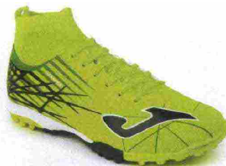
JOMA CHAMPION TF misure: EUR da 39 a 47 - peso: g 229 - prezzo: euro 65,00

Tomaia in Fibertech con doppie cuciture di rinforzo e leggera imbottitura sull'avampiede e contrafforte tallonare rinforzato M Counter. Allacciatura tradizionale. Sottopiede di montaggio in Texon e PVC. Intersuola in EVA. Suola in gomma multiacchettata. Indicata per giocatori di qualsiasi livello tecnico.