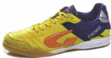
GEMS VIPER misure: EUR da 36 a 46 - peso: g 260 - prezzo: euro 75,00

Tomaia in pelle di vitello pieno fiore (anteriore) e materiale sintetico con protezione in microfibra sulla punta; contrafforte tallonare Rearfoot Stabilizer. Allacciatura tradizionale. Plantare sagomato in EVA, traspirante ed estraibile. Intersuola in EVA espansa con tecnologia XG. Suola non-marking, in gomma naturale con inserti a doppia densità. Indicata per giocatori di medio e alto livello tecnico.