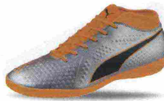
PUMA ONE 4 SYN IT misure: UK da 6 a 12 - prezzo: euro 50,00

Tomaia realizzata su struttura slip-on, in materiale sintetico con protezione aggiuntiva sul puntale, calzino integrato in Spandex. Allacciatura tradizionale, adattabile alle proprie esigenze, tramite due linee di fori. Plantare sagomato in EVA, estraibile. Suola in gomma. Indicata per giocatori di qualsiasi livello tecnico.