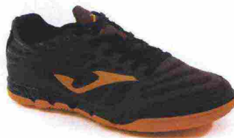
JOMA SUPER REGATE IN misure: EUR da 36 a 47 - peso: g 255 - prezzo: euro 70,00

Tomaia in nylon mesh e microfibra con rinforzi termosaldati in TPU; puntalino di protezione in TPU sulla punta; sistema di ventilazione VTS. Allacciatura tradizionale. Plantare sagomato in EVA. Intersuola in Phylon con profondi intagli di flessione. Suola in gomma con tecnologia Flexo. Indicata per giocatori di medio e alto livello tecnico.