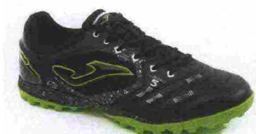
JOMA LIGA 5 TF misure: EUR da 36 a 47 - peso: g 261 - prezzo: euro 55,00

Tomaia in Fibertech con pannelli in mesh e puntalino di protezione in gomma sulla punta, sistema di ventilazione VTS. Allacciatura tradizionale. Plantare in EVA termoformata. Sottopiede di montaggio in Texon. Intersuola in EVA. Suola in gomma resistente all'abrasione DIN-70, multiacchettata. Indicata per giocatori di qualsiasi livello tecnico.