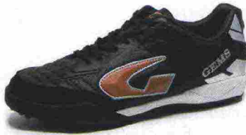
GEMS VIPER FX TURF misure: EUR da 36 a 46 - peso: g 290 - prezzo: euro 80,00

Tomaia in pelle di vitello pieno fiore (anteriore) e materiale sintetico con protezione in microfibra sulla punta; contrafforte tallonare Rearfoot Stabilizer. Allacciatura tradizionale. Plantare sagomato in EVA, trasparente ed estraibile. Intersuola in EVA espansa con tecnologia XG. Suola non-marking, in gomma con tassellatura a elementi geometrici eterogenei. Indicata per giocatori di medio e alto livello tecnico. Note del produttore: la pelle pieno fiore utilizzata per la realizzazione della tomaia è italiana.