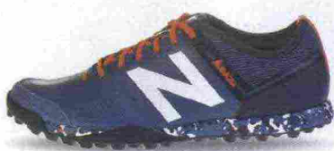
NEW BALANCE AUDAZO 3.0 TURF misure: US da 6m a 12 - prezzo: euro 90,00

Tomaia in materiale sintetico con doppie cuciture di rinforzo e leggera imbottitura sull'avampiede. Allacciatura tradizionale, con stringhe piatte. Plantare in EVA. Suola in gomma, multitacchettata. Indicata per giocatori di qualsiasi livello tecnico.