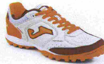
JOMA TOP FLEX TF misure: EUR da 36 a 47 - peso: g 270 - prezzo: euro 79,00

Tomaia in Fibertech con doppie cuciture di rinforzo e con puntalino di protezione sulla punta. Allacciatura tradizionale, con linguetta in mesh. Plantare in EVA termoformata. Suola in gomma antiabrasione DIN-70, multiacchettata. Indicata per giocatori di qualsiasi livello tecnico.