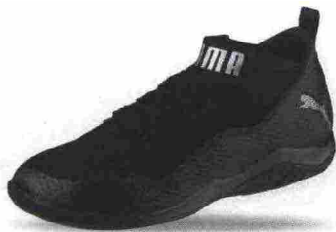
PUMA 365 IGNITE FUSE 2 misure: UK da 6 a 12 - prezzo: euro 90,00

Tomaia realizzata su struttura slip-on, in mesh con protezioni e rinforzi termosaldati. Allacciatura con stringhe trattenute dalla tecnologia FuseFit con 6 supporti laterali, per una chiusura personalizzabile. Plantare sagomato in EVA, estraibile. Intersuola in Ignite Foam. Suola in gomma, ad alta trazione. Indicata per atleti di medio e alto livello tecnico.