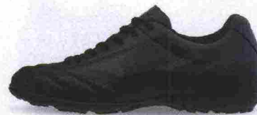
MIZUNO MONARCIDA NEO AS misure: US da 7 a 13 - peso: g 225 - prezzo: euro 50,00

le indossano. Portate alla ribalta in mondovisione da fuoriclasse sempre più fashion addicted , queste chiazze di colori fluo impazzano da tempo in partite e campionati di tutti i livelli. Sempre più sgargianti, sempre più aggressive, sempre più alla moda; grazie al loro forte impatto stilistico e all'inconfondibile presenza scenica... in campo rischiano di farsi notare più delle prodezze tecniche!