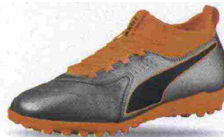
PUMA ONE 3 LTH TT misure: UK da 6 a 12 - prezzo: euro 75,00

Tomaia in microfibra con pannello in mesh e protezione in suede sulla punta. Allacciatura tradizionale con linguetta in mesh. Plantare in Fresh Foam, estraibile. Intersuola in REVlite. Suola in gomma multitacchettata. Indicata per l'atleta di medio e alto livello tecnico.