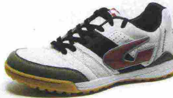
GEMS VERTIGO FX misure: EUR da 39 a 46 - prezzo: euro 95,00

Tomaia in materiale poliuretano con doppie cuciture di rinforzo sull'avampiede. Allacciatura tradizionale. Plantare sagomato in EVA, trasparente ed estraibile. Intersuola in EVA espansa con tecnologia XG e inserto Arch Block in TPU a sostegno dell'arco plantare. Suola non-marking, in gomma con tassellatura Dotted Hell. Indicata per giocatori di qualsiasi livello tecnico.