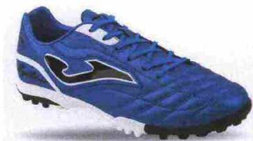
JOMA AGUILA TF misure: EUR da 39 a 47 - peso: g 266 - prezzo: euro 39,90

Tomaia in Fibertech con doppie cuciture di rinforzo e leggera imbottitura sull'avampiede e contrafforte tallonare rinforzato M Counter. Allacciatura tradizionale. Sottopiede di montaggio in Texon e PVC. Intersuola in EVA. Suola in gomma multiacchettata. Indicata per giocatori di qualsiasi livello tecnico.