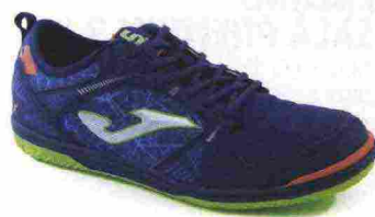
JOMA SALA MAX IN misure: EUR da 39 a 47 - peso: g 274 - prezzo: euro 48,00

Tomaia in pelle di vitello con rinforzo in microfibra sulla punta e pannelli in mesh; sistema di ventilazione VTS. Allacciatura tradizionale, con linguetta in mesh. Plantare in EVA termofornata. Sottopiede di montaggio in Texon. Intersuola con inserto ammortizzante in EVA nella zona tallonare. Suola in gomma resistente all'abrasione DIN-70 con tecnologia Rotation. Indicata per calciatori di medio e alto livello tecnico.