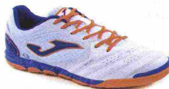
JOMA LIGA 5 IN misure: EUR da 36 a 47 - peso: g 255 - prezzo: euro 55,00

Tomaia in Fibertech con pannelli in mesh e puntalino di protezione in gomma sulla punta; sistema di ventilazione VTS. Allacciatura tradizionale, con linguetta in mesh. Plantare EVA termofornata. Sottopiede di montaggio in Texon. Intersuola in EVA. Suola in gomma, resistente all'abrasione DIN-70 con tecnologia Rotation. Indicata per giocatori di qualsiasi livello tecnico.