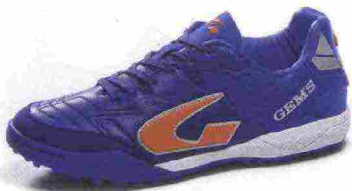
GEMS VIPER FX TURF misure: EUR da 36 a 46 - peso: g 290 - prezzo: euro 80,00

Tomaia in pelle italiana di vitello pieno fiore con supporto mediale PowerFit Sling e protezione in microfibra sulla punta; contrafforte tallonare Heel-Protection. Allacciatura tradizionale, integrata e a sostegno della tomaia tramite supporto PowerFit Sling. Plantare sagomato in EVA, trasparente ed estraibile. Intersuola in EVA espansa con tecnologia XG. Suola non-marking, in gomma naturale con design Hybrid-Core. Indicata per giocatori professionisti e di alto livello tecnico. Note del produttore: suola studiata per essere utilizzata anche sui terreni indoor.