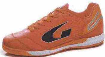
GEMS TIGER EVO misure: EUR da 36 a 46 - peso: g 270 - prezzo: euro 55,00

OUTDOOR - Le scarpe specifiche per questa specialità presentano un battistrada multitacchettato, poiché si rivolgono a competizioni giocate su un terreno sintetico, dove è necessario far presa in tempi rapidi e consentire i cambi di direzione tipici del gioco. Possono essere usate anche nel calcio a 11, se giocato su superfici artificiali o su fondi naturali particolarmente duri.