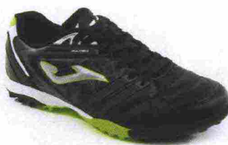
JOMA MAXIMA TF misure: EUR da 39 a 47 - peso: g 257 - prezzo: euro 39,90

Tomaia in Fibertech e nylon mesh con puntalino di protezione in gomma sulla punta, sistema di ventilazione VTS. Allacciatura tradizionale, con linguetta in mesh. Plantare in EVA termoformata. Intersuola in Phylon con sistema Pulsor: inserti ammortizzanti in Gel posizionati sia nella zona tallonare sia nell'avampiede. Suola in gomma antiabrasione DIN-70, multiacchettata. Indicata per giocatori di qualsiasi livello tecnico.