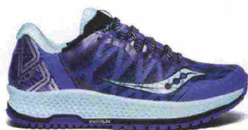
SAUCONY KOA TR misure: US da 5 a 12 - peso: g 255 - prezzo: euro 149,00

Tomaia in trail mesh protettivo con applicazioni e rinforzi termosaldati e cucite; membrana in Gore-Tex. Allacciatura integrata e a supporto della tomaia. Intersuola in IMEVA (EVA iniettata e stampata) con sistema ammortizzante Grid nella zona tallonare. Differenziale 8 mm (17,5/25,5). Suola in gomma al carbonio XT-600. Note del produttore , categoria Saucony: Tech Running/Trail.