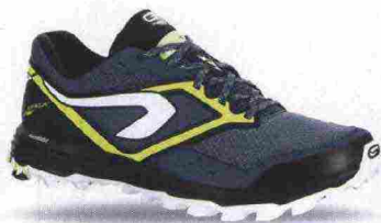
KALENJI KIPRUN XT7 misure: EUR da 40 a 47 - prezzo: euro 69,99

Tomaia in mesh con rinforzi in materiale sintetico e ampia protezione in gomma nella parte anteriore. Allacciatura tradizionale, trattenuta da fettucce, con taschino per le stringhe. Plantare EssenSole, con trattamento antibatterico, estraibile. Intersuola in EVA Kalensole con sistema ammortizzante K-Ring nella zona tallonare e concetto K-Only abbinato allo stabilizzatore. Differenziale 10 mm. Suola CrossContact, in gomma. Note del produttore: adatta a qualsiasi tipo di appoggio.