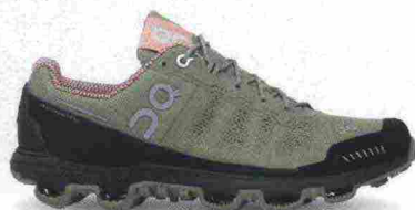
ON CLOUDVENTURE misure: US da 5 a 11 - peso: g 245 - prezzo: euro 159,95

Tomaia in mesh ingegnerizzato con rinforzi termosaldati e in materiale sintetico con protezione Toe Protect in gomma sulla punta. Plantare sagomato e traforato, estraibile. Intersuola in REVlite con piastra di protezione RockStop. Differenziale 8 mm. Suola in Vibram MegaGrip. Note del produttore , categoria New Balance: Trail Running Neutral Cushioning.