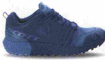
SCOTT KINABALU misure: US da 6 a 11 - prezzo: euro 155,00

Tomaia realizzata senza cuciture, in rete mesh con gabbia termoplastica in KPU. Allacciatura tradizionale. Plantare in materiale bicomponente, anallergico e antibatterico. Intersuola in EVA. Differenziale 5 mm. Suola Vibram MegaGrip.