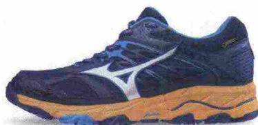
MIZUNO WAVE MUJIN 5 GTX misure: US da 6m a 11m - peso: g 320 - prezzo: euro 155,00

Tomaia assemblata con design DynamotionFit, in Jacquard mesh (anteriore) e mesh con rifiniture in materiale sintetico e protezione sulla punta. Plantare Premium, estraibile. Intersuola in AP+ e U4icX con tecnologia ammortizzante e stabilizzante Fan Shaped Wave concavo nella zona posteriore; piastra di protezione ESS Rock nell'avampede. Differenziale 12 mm (18/30). Suola costruita con tecnologia XtaRide, in gomma Michelin. Note del produttore , categoria Mizuno: Trail Running Protection.