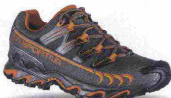
LA SPORTIVA ULTRA RAPTOR GTX misure: EUR da 38 a 47m - peso: g 410 - prezzo: euro 175,00

Tomaia in mesh idrorepellente e antiabrasione con collarino Sock-Shield, stampa in sublimazione e protezione in gomma sulla punta; membrana Gore-Tex. Allacciatura rapida ed elasticizzata, con tasca portallacci integrata e a scomparsa. Plantare Ortholite Mountain Running Ergonomic da 4 mm. Intersuola in MEMlex EVA a iniezione con inserto Stabilizer. Differenziale 10 mm. Suola in miscela FriXion AT, compatibile con chiodi amovibili AT Grip. Note del produttore, categoria La Sportiva: Trail Mountain Running Endurance.