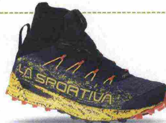
LA SPORTIVA URAGANO GTX misure: EUR da 38 a 47m - peso: g 350 - prezzo: euro 189,00

Tomaia in mesh resistente con fascia di rinforzo in microfibra, spalmatura antiabrasione e protezione in gomma sulla punta; membrana Gore-Tex. Allacciatura integrata e a supporto della tomaia, tramite rinforzi ad alta frequenza. Plantare Ortholite Mountain Running. Intersuola in MEMlex EVA a iniezione. Differenziale 12 mm. Suola in miscela FriXion con IBS (Impact Brake System). Note del produttore, categoria La Sportiva: Trail Mountain Running Endurance.