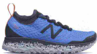
NEW BALANCE FRESH FOAM HIERROV3 misure: US da 5 a 11 - peso: g 269 - prezzo: euro 135,00

Tomaia assemblata con design DynamotionFit, in Jacquard mesh (anteriore) e mesh con rifiniture in materiale sintetico e protezione sulla punta; membrana Gore-Tex. Plantare Premium, estraibile. Intersuola in AP+ e U4icX con tecnologia ammortizzante e stabilizzante Fan Shaped Wave concavo nella zona posteriore; piastra di protezione ESS Rock nell'avampede. Differenziale 12 mm (18/30). Suola costruita con tecnologia XtaRide, in gomma Michelin. Note del produttore , categoria Mizuno: Trail Running Protection.