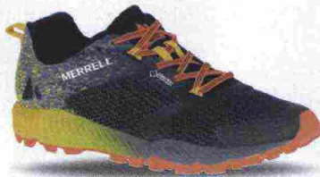
MERRELL ALL OUT CRUSH 2 GTX misure: US da 7 a 14 - prezzo: euro 129,99

Tomaia in mesh con applicazioni termosaldate e con supporto tallonare sagomato Hyperlock in TPU; membrana Gore-Tex InvisibleFit e trattamento M-Select Fresh. Allacciatura composta da lacci trattenuti dal sistema Omni-Fit Lacing. Plantare sagomato in EVA, estraibile. Intersuola in EVA con scanalature bidirezionali FLEXconnect e inserto ammortizzante Merrell Air Cushion Viz nella zona tallonare. Differenziale 6 mm (12/18). Suola M-Select Grip+. Note del produttore , categoria Merrell: Nature's Gym.