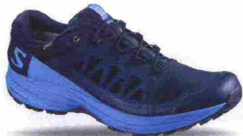
SALOMON XA ELEVATE GTX misure: UK da 6m a 13m - peso: g 310 - prezzo: euro 155,00

Tomaia in Open mesh con protezioni e rinforzi SensiFit termosaldati; membrana Gore-Tex. Allacciatura Quicklace con tasca per le stringhe. Plantare sagomato in EVA. Intersuola con costruzione Advanced Chassis e Profeel Film, in EVA a doppia densità con ammortizzante EnergyCell+. Differenziale 8 mm (17/25). Suola Premium Wet Traction Contagrip. Note del produttore , categoria Salomon: Trail Running.