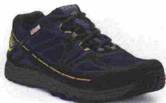
TOPO ATHLETIC HYDROVENTURE misure: US da 8 a 13 - peso: g 275 - prezzo: euro 170,00

Tomaia in mesh con rinforzi termosaldati e inserti rifrangenti; protezione laterale in gomma e in TPU sulla punta. Allacciatura tradizionale, trattenuta da fettucce. Plantare sagomato in EVA da 5 mm, estraibile. Intersuola in EVA. Differenziale 3 mm (20/23). Suola in gomma con tasselli multidirezionali. Note del produttore , categoria Topo Athletic: Trail.