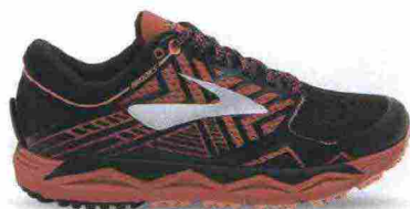
BROOKS CALDERA 2 misure: US da 5 a 12 - peso: g 241 - prezzo: euro 140,00

Tomaia in mesh con applicazioni termosaldate e protezioni in materiale sintetico su punta e tallone; membrana Gore-Tex. Plantare in EVA. Intersuola in SpEVA con unità ammortizzante Gel nella parte anteriore e con piastra di protezione Rock; stabilizzatore, interno, Trusstic. Differenziale 10 mm. Suola in gomma solida con disegno specifico da trail. Note del produttore , categoria Asics: Running Trail.