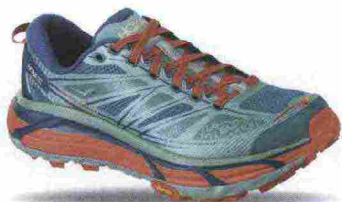
HOKA ONEONE MAFATE SPEED 2 misure: US da 5 a 11 - peso: g 272 - prezzo: euro 180,00

Tomaia in mesh chiuso con fascia termosaldata in 3D Rubber Print Mud Guard a 360°, logo riflettente. Allacciatura tradizionale, integrata e a sostegno della tomaia, tramite fascia mediale. Intersuola in mescola BioMoGo DNA con Midfoot Transition Zone e con stabilizzatori Pivot Post abbinati al DRB (Diagonal Roll Bar). Differenziale 10 mm. Suola in mescola HPR Green con disegno ad alette multidirezionali di dimensioni differenti. Note del produttore , categoria Brooks: Trail/Energize.