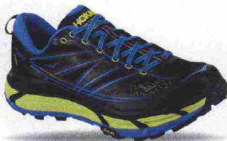
HOKA ONEONE MAFATE SPEED 2 misure: US da 7 a 14 - peso: g 329 - prezzo: euro 180,00

Tomaia assemblata su struttura SpeedFrame (senza cuciture), in mono mesh antideformazione con applicazioni termosaldate, protezione sulla punta e contrafforte esterno, in TPU. Plantare Ortholite, modellato ed estraibile. Intersuola in CMEVA e R-MAT, con geometria Meta-Rocker e stabilizzatore a supporto dell'arco plantare. Differenziale 4 mm (29/33). Suola in Vibram Mega-Grip con inserti in gomma antiabrasione.