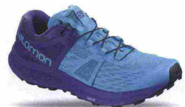
SALOMON ULTRA PRO W misure: UK da 3m a 10m - peso: g 292 - prezzo: euro 150,00

Tomaia assemblata senza cuciture, in mesh tecnico con protezioni (laterali, tallone e punta) in gomma; arricchita di membrana On (impermeabile e traspirante). Allacciatura con sistema di stringhe progressivo; trattenuta da fettucce integrate alla tomaia. Plantare estraibile. Intersuola con inserto Speedboard in polipropilene. Differenziale 6 mm. Suola in gomma con scanalature triangolari ed elementi incipienti Cloud: ad arco su punta e tallone, a dente di squalo sui lati e direzionali a diamante. Note del produttore , categoria On: Trail Waterproof.