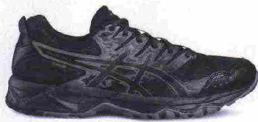
ASICS GEL SONOMA 3 G-TX misure: US da 6 a 15 - prezzo: euro 100,00

Note del produttore: categoria Asics: Running Trail.