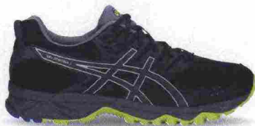
ASICS GEL SONOMA 3 misure: US da 6 a 15 - prezzo: euro 85,00

Tomaia in mesh con applicazioni termosaldate e protezioni in materiale sintetico su punta e tallone. Plantare in EVA. Intersuola in SpEVA con unità ammortizzante Gel nella parte anteriore e con piastra di protezione Rock; stabilizzatore, interno, Trusstic. Differenziale 10 mm. Suola in gomma solida con disegno specifico da trail.