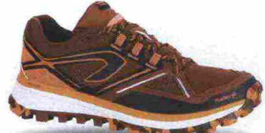
KALENJI KIPRUN TRAIL MT misure: EUR da 36 a 42 - prezzo: euro 79,99

Tomaia assemblata su struttura SpeedFrame (senza cuciture), in Open mesh con applicazioni termosaldate e protezione in gomma sulla punta. Plantare Ortholite, modellato ed estraibile. Intersuola in CMEVA con geometria Meta-Rocker. Differenziale 5 mm (30/35). Suola con inserti in gomma antiabrasione e tasselli da 4 mm. Note del produttore , categoria Hoka OneOne: Trail ATR.