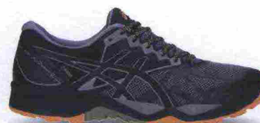
ASICS GEL FUJITRABUCO 6 G-TX misure: US da 6 a 15 - prezzo: euro 150,00

Tomaia in mesh con applicazioni termosaldate e protezioni in TPU su punta, lati e tallone. Allacciatura tradizionale, con tasca per le stringhe. Plantare ComfortDry, estraibile. Intersuola in Solyte con unità ammortizzante Gel nella zona tallonare e con piastra di protezione Rock. Differenziale 8 mm. Suola in gomma solida con inserto Ahar+ nel tallone e disegno specifico da trail; tecnologia IGS (Impact Guidance System). Note del produttore: categoria Asics: Running Trail.