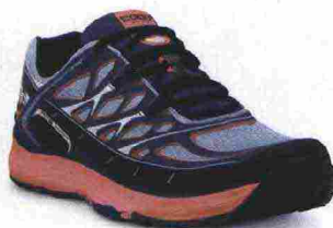
TOPO ATHLETIC MT-2 misure: US da 6 a 11 - peso: g 207 - prezzo: euro 135,00

Tomaia realizzata senza cuciture, in mesh con inserto in TPU nella parte posteriore, rinforzi termosaldati e protezione in gomma sulla punta; membrana Gore-Tex. Allacciatura tradizionale, integrata e a sostegno della struttura della tomaia. Plantare in materiale bicomponente, anallergico e antibatterico. Intersuola in AeroFoam+ con tecnologia Ergologic Ride. Differenziale 8 mm. Suola in gomma con disegno del battistrada Wet Traction.