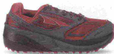
ALTRA RUNNING OLYMPUS 3.0 misure: US da 5m a 11 - peso: g 232 - prezzo: euro 155,00

Tomaia in resistente mesh con membrana idrorepellente eVent, rinforzi in materiale sintetico e protezione in TPU su punta e tallone. Plantare Contour da 5 mm, estraibile. Intersuola in EVA con piastra di protezione StoneGuard a tutta lunghezza. Altezza 25 mm. Differenziale 0 mm. Suola Altra MaxTrac con inserto DuraTread e disegno TrailClaw a trazione multidirezionale. Note del produttore : possibilità di inserimento di ghetta tramite tecnologia GaterTrap. Categoria Altra Running: Trail Moderate Cushion.