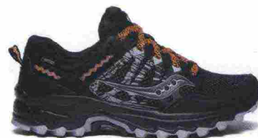
SAUCONY EXCURSION TR12 GTX misure: US da 5 a 12 - peso: g 269 - prezzo: euro 155,00

Tomaia in mesh con rinforzi SensiFit in materiale sintetico, protezione in gomma sulla punta; membrana Gore-Tex. Allacciatura Quicklace con tasca per le stringhe. Plantare Ortholite. Intersuola con costruzione 3D Advanced Chassis, in EVA compressa e iniettata con ammortizzante EnergyCell+. Differenziale 11 mm. (16/27). Suola Premium Wet Traction Contagrip. Note del produttore , categoria Salomon: Trail Running.