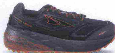
ALTRA RUNNING OLYMPUS 3.0 misure: US da 8 a 14 - peso: g 303 - prezzo: euro 155,00

Tomaia in resistente mesh con membrana idrorepellente eVent, rinforzi in materiale sintetico e protezione in TPU su punta e tallone. Plantare Contour da 5 mm, estraibile. Intersuola in EVA con piastra di protezione StoneGuard a tutta lunghezza. Altezza 25 mm. Differenziale 0 mm. Suola Altra MaxTrac con inserto DuraTread e disegno TrailClaw a trazione multidirezionale. Note del produttore: possibilità di inserimento di ghetta tramite tecnologia GaiterTrap. Categoria Altra Running: Trail Moderate Cushion.