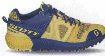
SCOTT KINABALU POWER misure: US da 6 a 11 - prezzo: euro 165,00

Tomaia realizzata senza cuciture, in rete mesh con rinforzi termosaldati e protezione in gomma su punta e tallone. Allacciatura tradizionale, trattenuta da fettucce. Plantare in materiale bicomponente, anallergico e antibatterico. Intersuola in AeroFoam+ con tecnologia Ergologic Ride. Differenziale 8 mm. Suola in gomma con disegno del battistrada Wet Traction.