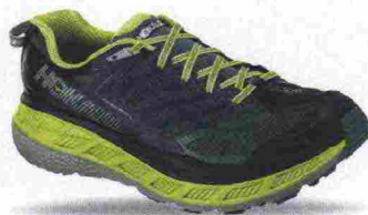
HOKA ONEONE STINSON ATR 4 misure: US da 7 a 15 - peso: g 336 - prezzo: euro 160,00

Note del produttore: scarpa ispirata da Karl Metzler (ultramaratoneta statunitense). Categoria Hoka OneOne: Trail.