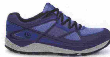
TOPO ATHLETIC TERRAVENTURE misure: US da 6 a 11 - peso: g 232 - prezzo: euro 150,00

Tomaia in mesh con rinforzi termosaldati e inserti rifrangenti; protezione laterale in gomma e in TPU sulla punta. Allacciatura tradizionale, trattenuta da fettucce. Plantare sagomato in EVA da 5 mm, estraibile. Intersuola in EVA. Differenziale 3 mm (20/23). Suola in gomma con tasselli multidirezionali. Note del produttore , categoria Topo Athletic: Trail.