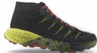
HOKA ONEONE SPEEDGOAT MID WP misure: US da 5 a 11 - peso: g 297 - prezzo: euro 170,00

Tomaia in Open mesh ingegnerizzato con applicazioni termosaldate, rinforzi strutturali SpeedFrame e protezione sulla punta. Allacciatura integrata e a sostegno della tomaia, tramite rinforzi SpeedFrame. Intersuola in EVA modellata e CMEVA. Differenziale 4 mm (26/30). Suola in Vibram Mega-Grip con tasselli da 5 mm dal disegno multidirezionale. Note del produttore : scarpa ispirata da Karl Melzter (ultramaratoneta statunitense). Categoria Hoka OneOne: Trail.