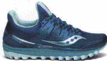
SAUCONY XODUS ISO misure: US da 5 a 12 - peso: g 326 - prezzo: euro 169,00

Tomaia in mesh con supporti termosaldati FlexFilm e protezione sulla punta con rinforzo sull'alluce; foderata in RunDry. Allacciatura integrata e a sostegno della tomaia. Intersuola in Everun. Differenziale 4 mm (18,5/22,5). Suola in gomma PowerTrac, con intagli profondi 3,5 mm. Note del produttore , categoria Saucony: Tech Running/Trail.