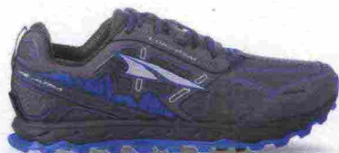
ALTRA RUNNING LONE PEAK 4.0 LOW RSM misure: US da 8 a 14 - peso: g 320 - prezzo: euro 150,00

Tomaia in resistente mesh con membrana idrorepellente eVent, rinforzi in materiale sintetico e protezione in TPU sulla punta. Plantare Contour da 5 mm, estraibile. Intersuola in EVA con piastra di protezione StoneGuard a tutta lunghezza. Altezza 25 mm. Differenziale 0 mm. Suola Altra MaxTrac con disegno TrailClaw a trazione multidirezionale. Note del produttore: possibilità di inserimento di ghetta tramite tecnologia GaiterTrap. Categoria Altra Running: Trail Moderate Cushion.