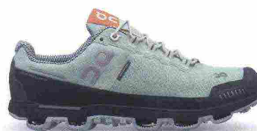
ON CLOUDVENTURE WATERPROOF misure: US da 5 a 11 - peso: g 245 - prezzo: euro 179,95

Tomaia assemblata senza cuciture, in mesh tecnico con protezioni (laterali, tallone e punta) in gomma; fodera con trattamento antibatterico. Allacciatura con sistema di stringhe progressivo e trattenuta da asole flessibili. Plantare estraibile. Intersuola con inserto Speedboard in polipropilene. Differenziale 6 mm. Suola in gomma con scanalature triangolari ed elementi Cloud di forma differente: a freccia su punta e tallone, a dente di squalo sui lati e a diamante. Note del produttore , categoria On: Trail Protection.