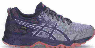
ASICS GEL SONOMA 3 G-TX misure: US da 5 a 12 - prezzo: euro 100,00

Tomaia in mesh con applicazioni termosaldate e protezioni in materiale sintetico su punta e tallone. Plantare in EVA. Intersuola in SpEVA con unità ammortizzante Gel nella parte anteriore e con piastra di protezione Rock; stabilizzatore, interno, Trusstic. Differenziale 10 mm. Suola in gomma solida con disegno specifico da trail. Note del produttore , categoria Asics: Running Trail.