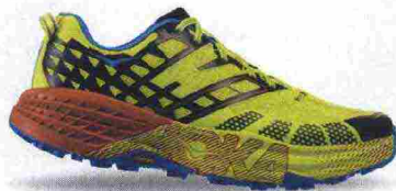
HOKA ONEONE SPEEDGOAT 2 misure: US da 7 a 14 - peso: g 278 - prezzo: euro 150,00

Note del produttore: categoria Hoka OneOne: Trail.