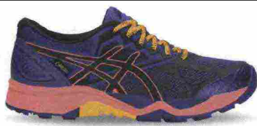
ASICS GEL FUJITRABUCO 6 G-TX misure: US da 5 a 12 - prezzo: euro 150,00

Tomaia in mesh con applicazioni termosaldate e protezioni in TPU su punta, lati e tallone. Allacciatura tradizionale, con tasca per le stringhe. Plantare ComforDry, estraibile. Intersuola in Solyte con unità ammortizzante Gel nella zona tallonare e con piastra di protezione Rock. Differenziale 8 mm. Suola in gomma solida con inserto Ahar+ nel tacco e disegno specifico da trail; tecnologia IGS (Impact Guidance System). Note del produttore , categoria Asics: Running Trail.