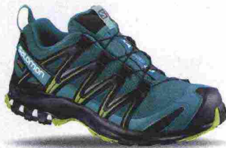
SALOMON XA PRO 3D GTX W misure: UK da 3m a 10m - peso: g 335 - prezzo: euro 160,00

Tomaia in Open mesh con ghetta integrata in tessuto elasticizzato con protezioni e rinforzi SensiFit, termosaldati. Allacciatura Quicklace con tasca per le stringhe. Plantare sagomato in EVA. Intersuola con costruzione Advanced Chassis e Profeel Film, in EVA a doppia densità con ammortizzante EnergyCell+. Differenziale 8 mm (17/25). Suola Premium Wet Traction Contagrip. Note del produttore , categoria Salomon: Trail Running.