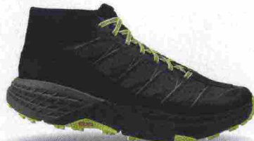
HOKA ONEONE SPEEDGOAT MID WP misure: US da 7 a 15 - peso: g 358 - prezzo: euro 170,00

Note del produttore: scarpa ispirata da Karl Metzler (ultramaratoneta statunitense). Categoria Hoka OneOne: Trail.