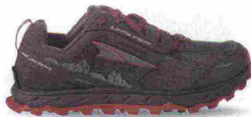
ALTRA RUNNING LONE PEAK 4.0 misure: US da 5m a 11 - peso: g 258 - prezzo: euro 140,00

Tomaia in resistente mesh chiuso con rinforzi in materiale sintetico e con sezioni in gomma a protezione della punta. Plantare Contour da 5 mm, estraibile. Intersuola in EVA con piastra di protezione StoneGuard a tutta lunghezza. Altezza 25 mm. Differenziale 0 mm. Suola Altra MaxTrac con disegno TrailClaw a trazione multidirezionale. Note del produttore : possibilità di inserimento di ghetta tramite tecnologia GaterTrap. Categoria Altra Running: Trail Moderate Cushion.