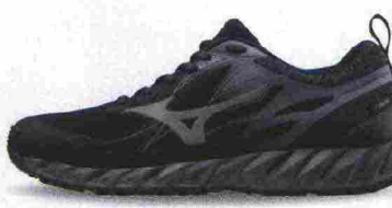
MIZUNO WAVE IBUKI GTX misure: US da 7 a 14 - peso: g 340 - prezzo: euro 115,00

Tomaia assemblata con design DynamotionFit, in Knit mesh (anteriore) e Air mesh con applicazioni termosaldate e protezione in gomma sulla punta. Intersuola in EL8 con tecnologia ammortizzante e stabilizzante Wave (interno) nella zona posteriore. Differenziale 10 mm (16,5/26,5). Suola in gomma X10 al carbonio con disegno dei tasselli a X. Note del produttore , categoria Mizuno: Trail Running Adaptivity.