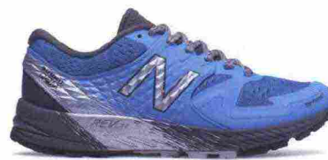
NEW BALANCE SUMMIT K.O.M. misure: US da 6 a 10 - peso: g 260 - prezzo: euro 125,00

Tomaia in Hyposkin con protezione Toe Protect in gomma sulla punta. calzata slip-on. Allacciatura tradizionale, trattenuta da fettucce, integrate alla tomaia. Plantare sagomato e traforato, estraibile. Intersuola assemblata con tecnologia Puzzle Fit, in Fresh Foam a geometrie intelligenti, convesse e concave. Differenziale 8 mm. Suola in Vibram MegaGrip. Note del produttore , categoria New Balance: serie Fresh Foam - Neutral Cushioning.