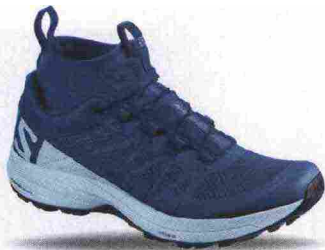
SALOMON XA ENDURO W misure: UK da 3m a 10m - peso: g 265 - prezzo: euro 160,00

Tomaia in Open mesh con ghetta integrata in tessuto elasticizzato con protezioni e rinforzi SensiFit, termosaldati. Allacciatura Quicklace con tasca per le stringhe. Plantare sagomato in EVA. Intersuola con costruzione Advanced Chassis e Profeel Film, in EVA a doppia densità con ammortizzante EnergyCell+. Differenziale 8 mm (17/25). Suola Premium Wet Traction Contagrip. Note del produttore , categoria Salomon: Trail Running.