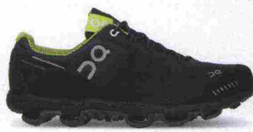
ON CLOUDVENTURE misure: US da 7 a 14 - peso: g 295 - prezzo: euro 159,95

Tomaia a doppio strato, in mesh tecnico idrorepellente con rinforzo sulla punta e protezioni in gomma su lati e tallone; fodera antibatterica. Allacciatura con sistema di stringhe progressivo. Plantare estraibile. Intersuola con inserto Speedboard in polipropilene. Differenziale 6 mm. Suola in gomma con scanalature triangolari ed elementi Cloud di forma differente: aa arco su punta e tallone, a dente di squalo sui lati e a diamante.