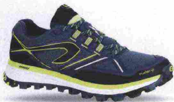
KALENJI KIPRUN TRAIL MT misure: EUR da 40 a 47 - prezzo: euro 79,99

Tomaia in mesh con rinforzi in materiale sintetico e ampia protezione in gomma nella parte anteriore. Allacciatura tradizionale, trattenuta da fettucce, con taschino per le stringhe. Plantare EssenSole, con trattamento antibatterico, estraibile. Intersuola in EVA Kalensole con sistema ammortizzante K-Ring nella zona tallonare e concetto K-Only abbinato allo stabilizzatore. Differenziale 10 mm. Suola CrossContact, in gomma. Note del produttore: adatta a qualsiasi tipo di appoggio.