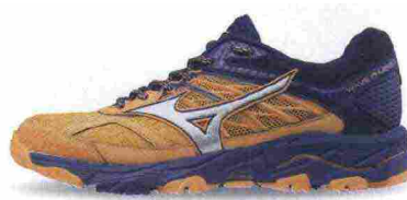
MIZUNO WAVE MUJIN 5 misure: US da 6m a 11m - peso: g 310 - prezzo: euro 145,00

Tomaia assemblata con design DynamotionFit, in resistente Air mesh con applicazioni termosaldate e protezione in gomma sulla punta; membrana Gore-Tex. Intersuola in EL8 con tecnologia ammortizzante e stabilizzante Wave (interno) nella zona posteriore. Differenziale 10 mm (16,5/26,5). Suola in gomma X10 al carbonio con disegno dei tasselli a X. Note del produttore , categoria Mizuno: Trail Running Adaptivity.