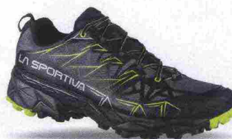
LA SPORTIVA AKYRA GTX misure: EUR da 38 a 47m - peso: g 350 - prezzo: euro 179,00

Tomaia in mesh con rinforzi in materiale sintetico e protezione in gomma sulla punta. Allacciatura tradizionale, con taschino per le stringhe. Plantare EssenSole, con trattamento antibatterico, estraibile. Intersuola in EVA Kalensole con sistema ammortizzante K-Ring nella zona tallonare e concetto K-Only abbinato allo stabilizzatore. Differenziale 10 mm. Suola in gomma antiabrasione con tasselli di 5 mm. Note del produttore: adatta a qualsiasi tipo di appoggio.