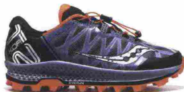
SAUCONY KOA ST misure: US da 7 a 14 - peso: g 292 - prezzo: euro 149,00

Tomaia in mesh Water Resistant con supporti termosaldati FlexFilm e protezione sulla punta con rinforzo sull'alluce; foderata in RunDry. Allacciatura integrata e a sostegno della tomaia. Intersuola in Everun. Differenziale 4 mm (23,5/27,5). Suola in PowerTrac al carbonio XT-900 con intagli profondi 8,5 mm. Note del produttore , categoria Saucony: Tech Running/Trail.