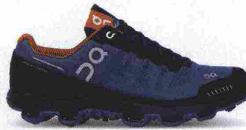
ON CLOUDVENTURE misure: US da 7 a 14 - peso: g 295 - prezzo: euro 159,95

Tomaia in Hyposkin con protezione Toe Protect in gomma sulla punta. Calzata slip-on. Allacciatura tradizionale, trattenuta da fettucce, integrate alla tomaia. Plantare sagomato e traforato, estraibile. Intersuola assemblata con tecnologia Puzzle Fit, in Fresh Foam a geometrie intelligenti, convesse e concave. Differenziale 8 mm. Suola in Vibram MegaGrip. Note del produttore , categoria New Balance: serie Fresh Foam - Neutral Cushioning.