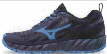
MIZUNO WAVE IBUKI misure: US da 6m a 11m - peso: g 275 - prezzo: euro 100,00

Tomaia assemblata con design DynamotionFit, in Knit mesh (anteriore) e Air mesh con applicazioni termosaldate e protezione in gomma sulla punta. Intersuola in EL8 con tecnologia ammortizzante e stabilizzante Wave (interno) nella zona posteriore. Differenziale 10 mm (16,5/26,5). Suola in gomma X10 al carbonio con disegno dei tasselli a X. Note del produttore , categoria Mizuno: Trail Running Adaptivity.