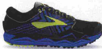
BROOKS CALDERA 2 misure: US da 7 a 15 - peso: g 281 - prezzo: euro 140,00

Note del produttore: categoria Asics: Running Trail.