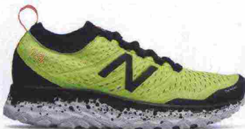
NEW BALANCE FRESH FOAM HIERROV3 Y3 misure: US da 7 a 14 - peso: g 328 - prezzo: euro 135,00

Tomaia in Hyposkin con protezione Toe Protect in gomma sulla punta. Calzata slip-on. Allacciatura tradizionale, trattenuta da fettucce, integrate alla tomaia. Plantare sagomato e traforato, estraibile. Intersuola assemblata con tecnologia Puzzle Fit, in Fresh Foam a geometrie intelligenti, convesse e concave. Differenziale 8 mm. Suola in Vibram MegaGrip. Note del produttore , categoria New Balance: serie Fresh Foam - Neutral Cushioning.