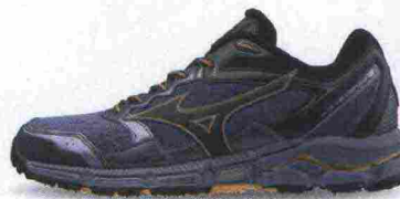
MIZUNO WAVE DAICHI 3 misure: US da 7 a 14 - peso: g 320 - prezzo: euro 135,00

Tomaia in mesh con applicazioni termosaldate in TPU e foderata il Lycra neoprene; membrana Gore-Tex InvisibleFit. Allacciatura tradizionale, integrata alla tomaia. Intersuola in EVA. Differenziale 6 mm (8/14). Suola M-Select Grip con tecnologia TrailProtect. Note del produttore , categoria Merrell: Nature's Gym.