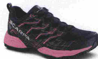
SCARPA NEUTRON 2 misure: EUR da 36 a 42 - peso: g 290 - prezzo: euro 149,00

Tomaia in mesh a trama differenziata con gabbia di contenimento Isofit e applicazioni termosaldate e cucite; contrafforte tallonare, esterno, in TPU. Allacciatura integrata e a sostegno della tomaia, tramite Isofit. Intersuola in Everun. Differenziale 4 mm (22,5/26,5). Suola in PowerTrac al carbonio XT-900 a doppia densità con intagli profondi 6 mm. Note del produttore , categoria Saucony: Tech Running/Trail.