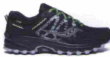
SAUCONY EXCURSION TR12 GTX misure: US da 7 a 14 - peso: g 332 - prezzo: euro 155,00

Tomaia in mesh con rinforzi SensiFit in materiale sintetico, protezione in gomma sulla punta e dettagli riflettenti a 360°; membrana Gore-Tex. Allacciatura Quicklace con tasca per le stringhe. Plantare Ortholite. Intersuola con costruzione 3D Advanced Chassis, in EVA compressa e iniettata con ammortizzante EnergyCell+. Differenziale 11 mm (16/27). Suola Premium Wet Traction Contagrip. Note del produttore , categoria Salomon: Trail Running.