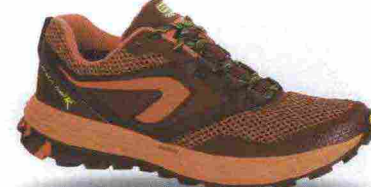
KALENJI KIPRUN TRAIL TR misure: EUR da 36 a 42 - peso: g 270 - prezzo: euro 49,99

Tomaia in mesh con rinforzi in materiale sintetico e ampia protezione in gomma nella parte anteriore. Allacciatura tradizionale, trattenuta da fettucce, con taschino per le stringhe. Plantare EssenSole, con trattamento antibatterico, estraibile. Intersuola in EVA Kalensole con sistema ammortizzante K-Ring nella zona tallonare e concetto K-Only abbinato allo stabilizzatore. Differenziale 10 mm. Suola CrossContact, in gomma. Note del produttore , adatta a qualsiasi tipo di appoggio.