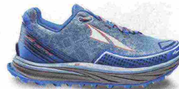
ALTRA RUNNING TIMP misure: US da 5m a 11 - peso: g 198 - prezzo: euro 145,00

Tomaia in resistente mesh con rinforzi in materiale scamosciato e con protezione in gomma sulla punta. Plantare Contour da 5 mm, estraibile. Intersuola in EVA a doppia densità con tecnologia InnerFlex. Altezza 33 mm. Differenziale 0 mm. Suola Vibram MegaGrip con disegno TrailClaw a trazione multidirezionale. Note del produttore : possibilità di inserimento di ghetta tramite tecnologia GaterTrap. Categoria Altra Running: Trail Max Cushion.