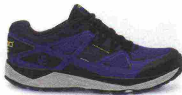
TOPO ATHLETIC TERRAVENTURE misure: US da 8 a 13 - peso: g 295 - prezzo: euro 150,00

Tomaia in mesh con rinforzi termosaldati, protezione in gomma sulla punta e inserti rifrangenti; membrana eVent (idrorepellente e traspirante). Plantare sagomato in EVA da 5 mm, estraibile. Intersuola in EVA con piastra di protezione, flessibile. Rock Plate. Differenziale 3 mm (20/23). Suola in gomma con tasselli multidirezionali. Note del produttore , categoria Topo Athletic: Trail.