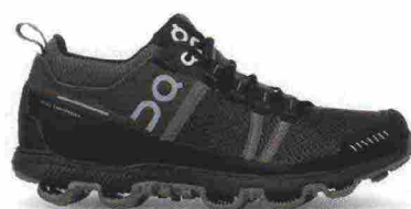
ON CLOUDVENTURE MIDTOP misure: US da 5 a 11 - peso: g 275 - prezzo: euro 169,95

Tomaia a doppio strato, in mesh tecnico idrorepellente con rinforzo sulla punta e protezioni in gomma su lati e tallone; fodera antibatterica. Allacciatura con sistema di stringhe progressivo. Plantare estraibile. Intersuola con inserto Speedboard in polipropilene. Differenziale 6 mm. Suola in gomma con scanalature triangolari ed elementi Cloud di forma differente: aa arco su punta e tallone, a dente di squalo sui lati e a diamante.