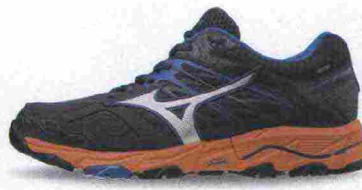
MIZUNO WAVE MUJIN 5 GTX misure: US da 7 a 14 - peso: g 375 - prezzo: euro 155,00

Tomaia assemblata con design DynamotionFit, in resistente Air mesh con applicazioni termosaldate e protezione in gomma sulla punta; membrana Gore-Tex. Intersuola in EL8 con tecnologia ammortizzante e stabilizzante Wave (interno) nella zona posteriore. Differenziale 10 mm (16,5/26,5). Suola in gomma X10 al carbonio con disegno dei tasselli a X. Note del produttore , categoria Mizuno: Trail Running Adaptivity.