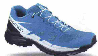
SALOMON WINGS PRO 3 W misure: UK da 3m a 10m - peso: g 255 - prezzo: euro 140,00

Tomaia in mesh con protezioni e rinforzi SensiFit termosaldati; foderata con EndoFit. Allacciatura Quicklace, integrata e a sostegno della tomaia; con tasca per le stringhe. Plantare Ortholite. Intersuola costruzione Proteel Film, in EVA compressa a doppia densità con ammortizzante EnergyCell+ nella zona tallonare e EnergySave nell'avampede. Differenziale 8 mm (18/26). Suola Premium Wet Traction Contagrip. Note del produttore , categoria Salomon: Trail Running.