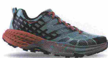
HOKA ONEONE SPEEDGOAT 2 misure: US da 5 a 11 - peso: g 233 - prezzo: euro 150,00

Tomaia assemblata su struttura SpeedFrame (senza cuciture), in mono mesh antidestrutti con applicazioni termosaldate, protezione sulla punta e contrafforte esterno, in TPU. Plantare Ortholite, modellato ed estraibile. Intersuola in CMEVA e R-MAT, con geometria Meta-Rocker e stabilizzatore a supporto dell'arco plantare. Differenziale 4 mm (27/31). Suola in Vibram Mega-Grip con inserti in gomma antiabrasione. Note del produttore , categoria Hoka OneOne: Trail.