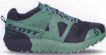
SCOTT KINABALU POWER GTX misure: US da 6 a 11 - prezzo: euro 179,00

Tomaia realizzata senza cuciture, in rete mesh con inserto in TPU nella parte posteriore, rinforzi termosaldati e protezione in gomma sulla punta. Allacciatura tradizionale, integrata e a sostegno della struttura della tomaia. Plantare in materiale bicomponente, anallergico e antibatterico. Intersuola in AeroFoam+ con tecnologia Ergologic Ride. Differenziale 8 mm. Suola in gomma con disegno del battistrada Wet Traction.