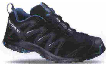
SALOMON XA PRO 3D GTX NOCTURNE misure: UK da 6m a 12m - peso: g 385 - prezzo: euro 170,00

Tomaia in Open mesh con protezioni e rinforzi SensiFit termosaldati; membrana Gore-Tex. Allacciatura Quicklace con tasca per le stringhe. Plantare sagomato in EVA. Intersuola con costruzione Advanced Chassis e Profeel Film, in EVA a doppia densità con ammortizzante EnergyCell+. Differenziale 8 mm (17/25). Suola Premium Wet Traction Contagrip. Note del produttore , categoria Salomon: Trail Running.