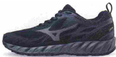
MIZUNO WAVE IBUKI GTX misure: US da 6m a 11m - peso: g 285 - prezzo: euro 115,00

Tomaia assemblata con design DynamotionFit, in Knit mesh (anteriore) e Air mesh con applicazioni termosaldate e protezione in gomma sulla punta. Intersuola in EL8 con tecnologia ammortizzante e stabilizzante Wave (interno) nella zona posteriore. Differenziale 10 mm (16,5/26,5). Suola in gomma X10 al carbonio con disegno dei tasselli a X. Note del produttore , categoria Mizuno: Trail Running Adaptivity.