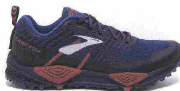
BROOKS CASCADIA 13 misure: US da 5 a 12 - peso: g 301 - prezzo: euro 140,00

Tomaia a doppio strato: Ariaprene traforato (interno) e Cordura AFT (esterno) con stampa 3D Rubber Print a protezione; Gaiter Tab integrato sul tallone. Intersuola in mescola BioMoGo DNA con struttura geometrica Rocker Transition. Differenziale 4 mm. Suola in gomma aderente con disegno ad alette. Note del produttore : possibilità di inserimento di ghetta tramite tecnologia GaiterTab. Categoria Brooks: Trail/Energize.