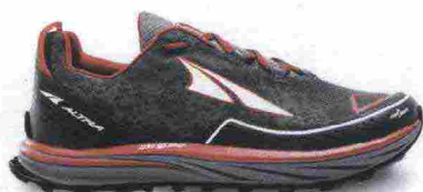
ALTRA RUNNING TIMP misure: US da 8 a 14 - peso: g 241 - prezzo: euro 145,00

Tomaia in resistente mesh con rinforzi in materiale scamosciato e con protezione in gomma sulla punta. Plantare Contour da 5 mm, estraibile. Intersuola in EVA a doppia densità con tecnologia InnerFlex. Altezza 33 mm. Differenziale 0 mm. Suola Vibram MegaGrip con disegno TrailClaw a trazione multidirezionale. Note del produttore: possibilità di inserimento di ghetta tramite tecnologia GaiterTrap. Categoria Altra Running: Trail Max Cushion.