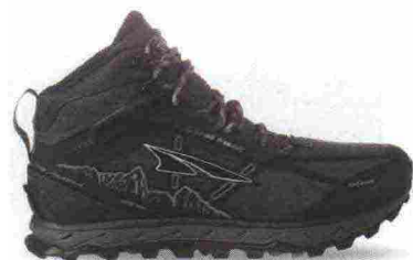
ALTRA RUNNING LONE PEAK 4.0 MID RSM misure: US da 5m a 11 - peso: g 335 - prezzo: euro 160,00

Tomaia in resistente mesh con membrana idrorepellente eVent, rinforzi in materiale sintetico e protezione in TPU sulla punta. Plantare Contour da 5 mm, estraibile. Intersuola in EVA con piastra di protezione StoneGuard a tutta lunghezza. Altezza 25 mm. Differenziale 0 mm. Suola Altra MaxTrac con disegno TrailClaw a trazione multidirezionale. Note del produttore : possibilità di inserimento di ghetta tramite tecnologia GaterTrap. Categoria Altra Running: Trail Moderate Cushion.