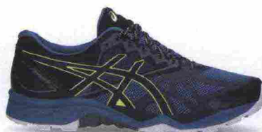
ASICS GEL FUJITRABUCO 6 misure: US da 6 a 15 - prezzo: euro 130,00

Tomaia idrorepellente e riflettente a 360° con protezioni in TPU su punta e tallone. Allacciatura asimmetrica. Plantare Contour da 5 mm, estraibile. Intersuola in EVA con ammortizzante A-Bound. Altezza 29 mm. Differenziale 0 mm. Suola Altra MaxTrack con disegno TrailClaw. Note del produttore: possibilità di inserimento di ghetta tramite tecnologia GaiterTrap. Categoria Altra Running: Trail Moderate Cushion.