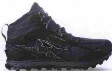
ALTRA RUNNING LONE PEAK 4.0 MID RSM misure: US da 8 a 14 - peso: g 405 - prezzo: euro 160,00

Tomaia in resistente mesh con membrana idrorepellente eVent, rinforzi in materiale sintetico e protezione in TPU sulla punta. Plantare Contour da 5 mm, estraibile. Intersuola in EVA con piastra di protezione StoneGuard a tutta lunghezza. Altezza 25 mm. Differenziale 0 mm. Suola Altra MaxTrac con disegno TrailClaw a trazione multidirezionale. Note del produttore: possibilità di inserimento di ghetta tramite tecnologia GaiterTrap. Categoria Altra Running: Trail Moderate Cushion.