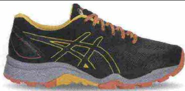
ASICS GEL FUJITRABUCO 6 misure: US da 5 a 12 - prezzo: euro 130,00

Tomaia in mesh con applicazioni termosaldate e protezioni in TPU su punta, lati e tallone. Allacciatura tradizionale, con tasca per le stringhe. Plantare ComforDry, estraibile. Intersuola in Solyte con unità ammortizzante Gel nella zona tallonare e con piastra di protezione Rock. Differenziale 8 mm. Suola in gomma solida con inserto Ahar+ nel tacco e disegno specifico da trail; tecnologia IGS (Impact Guidance System). Note del produttore , categoria Asics: Running Trail.