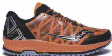
SAUCONY KOA TR misure: US da 7 a 14 - peso: g 292 - prezzo: euro 149,00

Tomaia in mesh Water Resistant con supporti termosaldati FlexFilm e protezione sulla punta con rinforzo sull'alluce; foderata in RunDry. Allacciatura integrata e a sostegno della tomaia. Intersuola in Everun. Differenziale 4 mm (23,5/27,5). Suola in PowerTrac al carbonio XT-900 con intagli profondi 8,5 mm. Note del produttore , categoria Saucony: Tech Running/Trail.