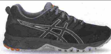
ASICS GEL SONOMA 3 misure: US da 5 a 12 - prezzo: euro 85,00

Tomaia in mesh con applicazioni termosaldate e protezioni in TPU su punta, lati e tallone; membrana Gore-Tex. Allacciatura tradizionale, con tasca per le stringhe. Plantare ComforDry, estraibile. Intersuola in Solyte con unità ammortizzante Gel nella zona tallonare e con piastra di protezione Rock. Differenziale 8 mm. Suola in gomma solida con inserto Ahar+ nel tacco e disegno specifico da trail; tecnologia IGS (Impact Guidance System). Note del produttore , categoria Asics: Running Trail.