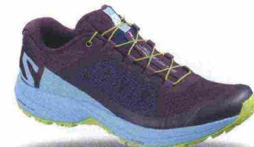
SALOMON XA ELEVATE W misure: UK da 3m a 10m - peso: g 255 - prezzo: euro 130,00

Tomaia in mesh con protezioni e rinforzi SensiFit, termosaldati. Allacciatura Quicklace con tasca per le stringhe. Plantare Ortholite. Intersuola con costruzione Proteel Film, in EVA compressa con inserto antipronazione Descent Control. Differenziale 9 mm (19/28). Suola Premium Wet Traction Contagrip. Note del produttore , categoria Salomon: Trail Running.