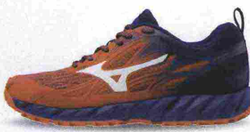
MIZUNO WAVE IBUKI misure: US da 7 a 14 - peso: g 325 - prezzo: euro 100,00

Tomaia assemblata con design DynamotionFit, in Air mesh a trama differenziata con rinforzi in materiale sintetico e protezioni in TPU su punta e tallone. Intersuola in AP+ con tecnologia ammortizzante e stabilizzante Parallel Wave concavo nella zona posteriore. Differenziale 12 mm (17/29). Suola costruita con tecnologia XtaticRide, in gomma Michelin dal disegno multidirezionale. Note del produttore , categoria Mizuno: Trail Running Adaptivity.