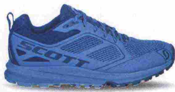
SCOTT ENDURO misure: US da 6 a 11 - prezzo: euro 155,00

Tomaia costruita con sistema Sock-Fit LW, in Fabric con applicazioni termosaldate e cucite in microfibra idrorepellente e protezione in TPU sulla punta. Allacciatura tradizionale, trattenuta da fettucce e dotata di tasca per le stringhe. Intersuola con ammortizzante Shock Absorbing nella zona tallonare e stabilizzatore in TPU. Differenziale 6 mm. Suola Vibram Genetic II con tasselli da 5 mm e tecnologia XRS (Extra Rebound System). Note del produttore , categoria SCARPA: Alpine Running.