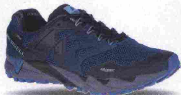
MERRELL AGILITY PEAK FLEX 2 GTX misure: US da 7 a 14 - prezzo: euro 149,99

Tomaia in mesh con applicazioni termosaldate e con supporto tallonare sagomato Hyperlock in TPU; membrana Gore-Tex InvisibleFit e trattamento M-Select Fresh. Allacciatura composta da lacci trattenuti dal sistema Omni-Fit Lacing. Plantare sagomato in EVA, estraibile. Intersuola in EVA con scanalature bidirezionali FLEXconnect e inserto ammortizzante Merrell Air Cushion Viz nella zona tallonare. Differenziale 6 mm (12/18). Suola M-Select Grip+. Note del produttore , categoria Merrell: Nature's Gym.