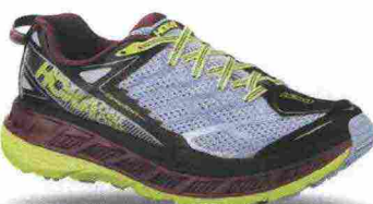
HOKA ONEONE STINSON ATR 4 misure: US da 5 a 11 - peso: g 272 - prezzo: euro 160,00

Tomaia in mesh con guaina idrorepellente SkyShell, protezioni e rinforzi termosaldati e contrafforte tallonare, esterno, in TPU. Allacciatura tradizionale. Intersuola in EVA modellata e CMEVA. Differenziale 4 mm (26/30). Suola in Vibram Mega-Grip con tasselli da 5 mm dal disegno multidirezionale. Note del produttore : scarpa ispirata da Karl Melzter (ultramaratoneta statunitense). Categoria Hoka OneOne: Trail.