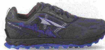
ALTRA RUNNING LONE PEAK 4.0 LOW RSM misure: US da 5m a 11 - peso: g 272 - prezzo: euro 150,00

Tomaia in resistente mesh chiuso con rinforzi in materiale sintetico e con sezioni in gomma a protezione della punta. Plantare Contour da 5 mm, estraibile. Intersuola in EVA con piastra di protezione StoneGuard a tutta lunghezza. Altezza 25 mm. Differenziale 0 mm. Suola Altra MaxTrac con disegno TrailClaw a trazione multidirezionale. Note del produttore : possibilità di inserimento di ghetta tramite tecnologia GaterTrap. Categoria Altra Running: Trail Moderate Cushion.