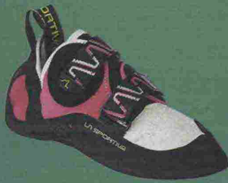
La Sportiva Katana Woman; prezzo: 135 €; info: lasportiva.com