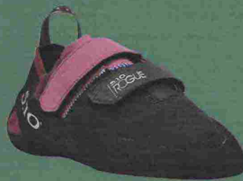
Five Ten Rogue Vcs W; prezzo: 86 €; info: adidasoutdoor.com

insoliti. Le nostre tester la suggeriscono soprattutto alle donne con una pianta del piede larga e alle principianti che cercano il comfort oltre alla sicurezza.