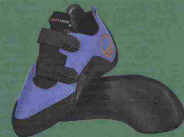
Wild Country Meshuga; prezzo: 165 €; info: wildcountry.com

alla miglior regolazione della calzata. Inoltre, la suola poco arcuata agevola le ascensioni di lunga durata così come le arrampicate più impegnative in palestra.