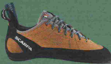
Scarpa Helix Wmn; prezzo: 79,95 €; info: scarpa.net

grado di comfort anche nelle arrampicate più lunghe. L'intersuola è molto più sottile in punta per lasciare maggiore sensibilità alle dita.