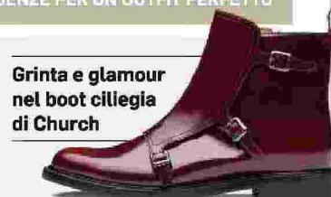
Grinta e glamour nel boot ciliegia di Church

L'ombrello rosso pieghevole di Carpisa è un'idea regalo molto pratica: il manico è sottile, ma resistente, il pomello piccolo garantisce un'impugnatura comoda. È un accessorio perfetto da portare sempre in borsa senza ingombrare, per uno stile vivace e allegro.