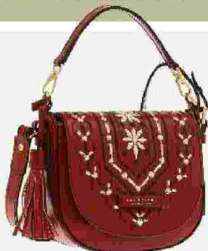
La tracolla The Bridge, pratica ed essenziale

IL GUARDAROBIA DELL'INVERNO È NEL SEGNO DEL NATALE. ABBIGLIAMENTO E ACCESSORI: LE MIGLIORI IDEE REGALO E LE ULTIME TENDENZE PER UN OUTFIT PERFETTO